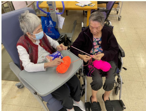
圖2：兩個院友正討論如何編織，其中一個院友正解釋何為高/低針。