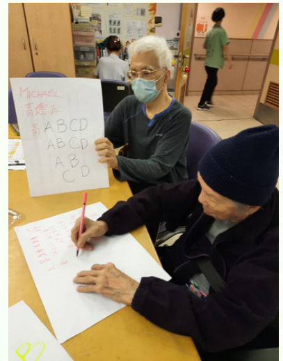
圖3：以前在外國生活的院友正作為小老師教授其他院友英文，院友們都好專心呢！