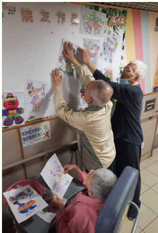
圖1：院友們互相討論如何設計聖誕壁報板 他們積極發表意見，就圖畫的擺位，顏色給予意見，完成後他們都滿意自己的作品。還要我為他們在壁報板前拍照留念。