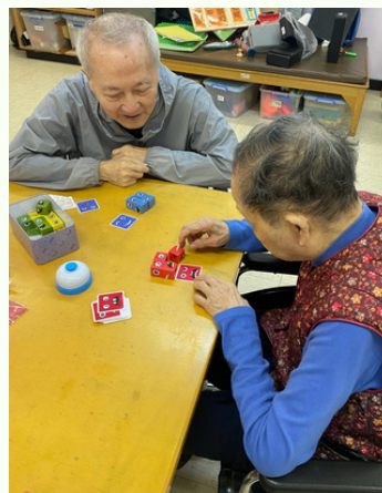
圖5：院友教新院友如何玩桌遊作認知訓練。