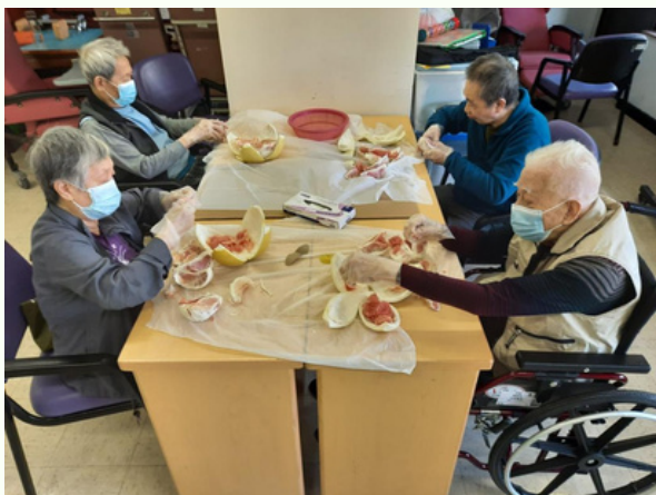
圖4：院友們好認真協助剝柚子同製作啫喱，還笑稱自己：工廠妹萬歲！