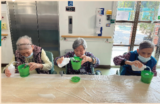
院友們觀察植物成長進度並為植物澆水

透過香港園藝治療協會邀請導師到院舍舉行園藝治療小組，讓院友能藉由植物啟發他們的五官六感，從視覺、聽覺、嗅覺、味覺、觸覺和參與自然活動中，感受植物豐富的生命能量，產生愉悅的心情，以療癒和撫慰心靈，同時延緩老退化。