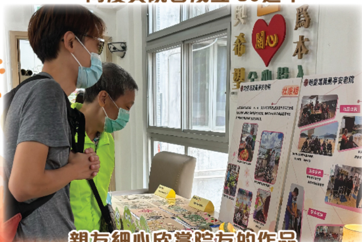
親友細心欣賞院友的作品