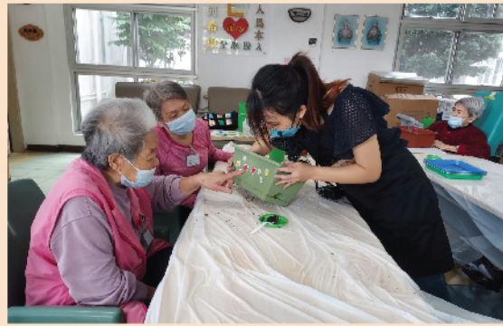
院友在盆上貼上對生菜種子種植的期望