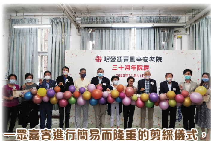
一眾嘉賓進行簡易而隆重的剪綵儀式， 一同慶賀院舍成立 30週年

本院為慶祝30週年於2023年11月11日(星期六)舉行院慶活動。活動很榮幸邀請到馮氏家族成員出席支持。當日節目內容豐富，由明愛打鼓嶺幼兒學校的學生以充滿動感的唱歌表演為院慶展開序幕。本院院友以「明愛伴我行」歌唱表演及非洲鼓表演為活動增添歡樂氣氛，全場一起唱和打拍子。嘉賓、親友和院友一起回顧院舍發展的影片，一起細味院舍30的變遷，共同見證院舍的成長。建築師馮先生更分享了興建本院時的設計理念，場面溫馨感人。未來，本院會繼續努力，致力提供優質服務予服務使用者。冀盼下一個十年，再與大家一同攜手慶賀！