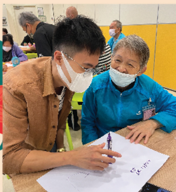
齊齊動下腦筋！ 抒發己見！

是次活動透過模擬發佈會的話劇更形象化地了解長聯的工作目標。院友們都表現得很雀躍，積極參與大會活動的交流分享環節，氣氛相當良好。