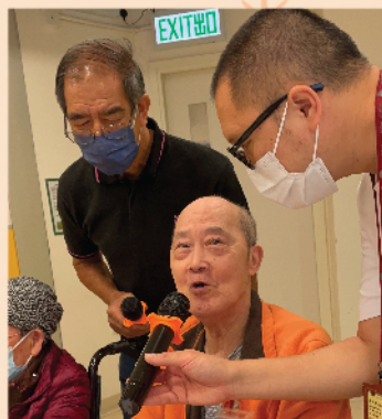
我好開心！可以發表自己的想法！