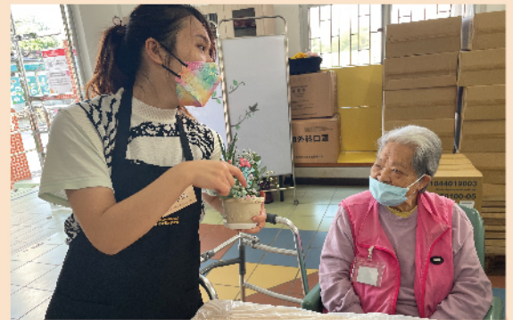
院友在認真聆聽導師指導