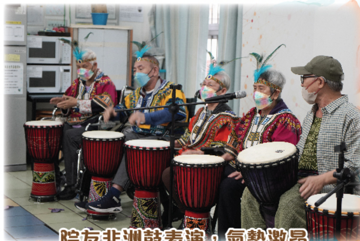
院友非洲鼓表演，氣勢激昂