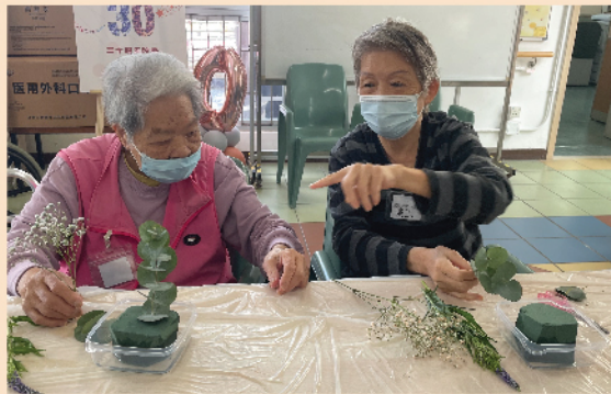
院友互相欣賞對方的植物且一同修剪植物形態