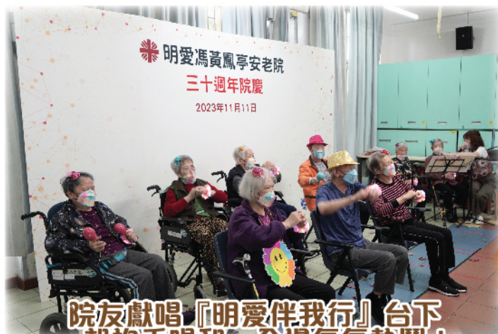
院友獻唱『明愛伴我行』台下 一起拍手唱和，全場氣氛熱鬧！