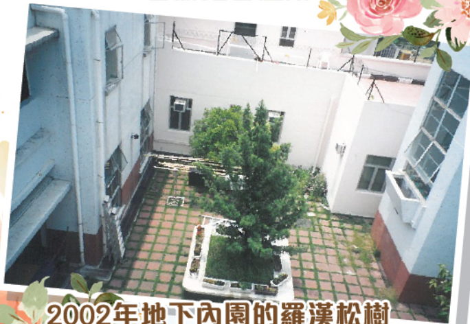
2002年地下內園的羅漢松樹