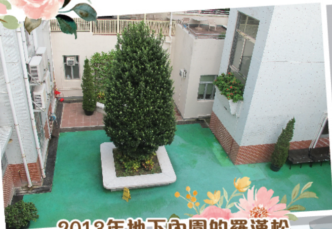
2013年地下內園的羅漢松