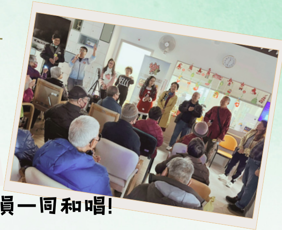
樂童創藝報佳音，與會員一同和唱!