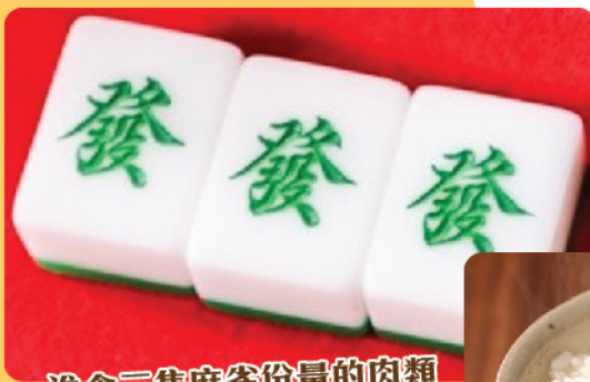
進食三隻麻雀份量的肉類