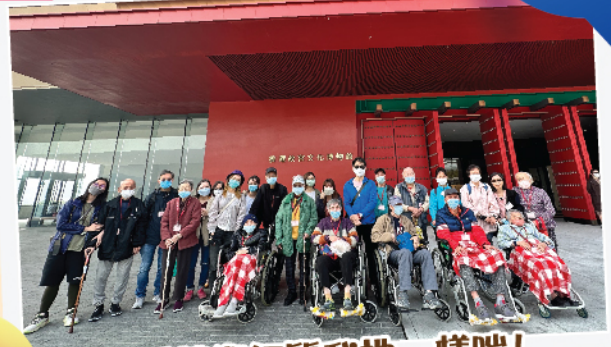
感受藝術氣質我地一樣啱! 今次去故宮博物館呀呀