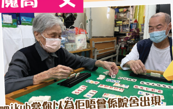
Rummikub當你以為佢唔會係院舍出現 少年! 你太年輕了 我地邏輯思維, 分析力以及運數能力都一流