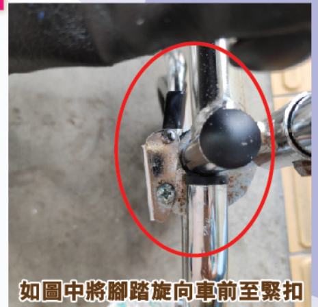
如圖中將腳踏旋向車前至緊扣