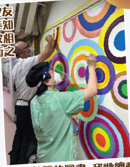
要拼成最美麗的圖畫，我哋總動員 齊心協力完成㗎

知道有草稿練習，不單是院友 非常踴躍，家屬和社區義工知 道後亦紛紛前來，可見大家相 當喜歡繪畫，位位均是藝術之