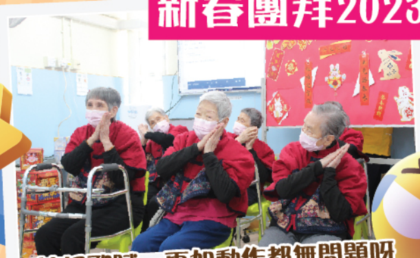
詩詞歌賦...再加動作都無問題呀