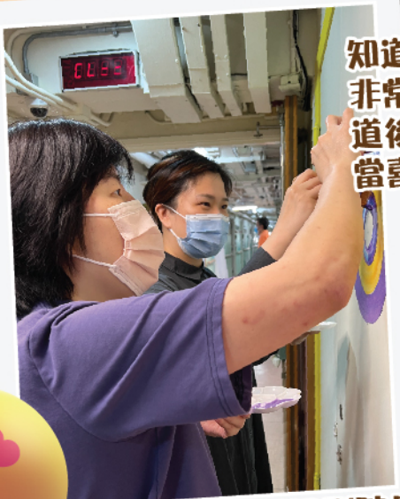
起筆 - 由院長同副院長 率先示範

知道有草稿練習，不單是院友 非常踴躍，家屬和社區義工知 道後亦紛紛前來，可見大家相 當喜歡繪畫，位位均是藝術之