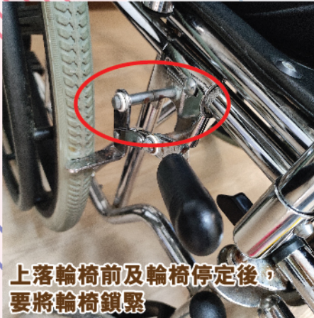
上落輪椅前及輪椅停定後，要將輪椅鎖緊