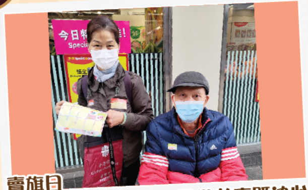
賣旗日 天氣再凍都唔影響我地做善事既決心