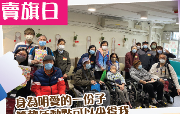
身為明愛的一份子 籌款活動點可以少得我 今次帶埋太太身體力行去支持活動