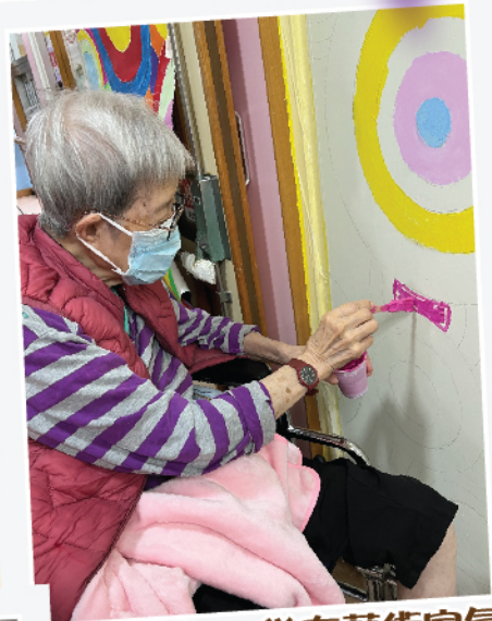
睇下我...幾有藝術家氣息