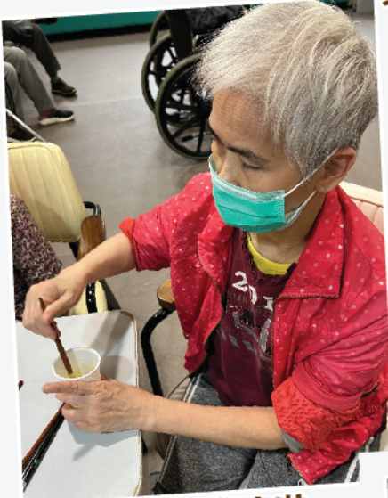
調色 - 無難度啦