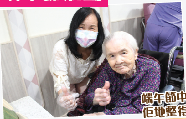
端午節中心義工送愛心粽 佢地整得好好食架