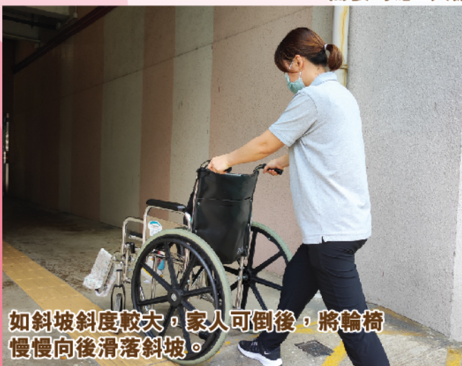
如斜坡斜度較大，家人可倒後，將輪椅慢慢向後滑落斜坡。