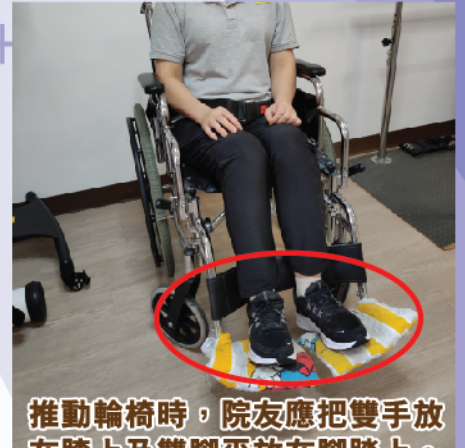
推動輪椅時，院友應把雙手放在膝上及雙腳平放在腳踏。確保小腿帶承托雙腳。