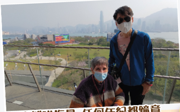
出城睇海景 任何年紀都鐘意