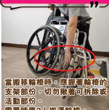
當搬移輪椅時，應握著輪椅的支架部份，切勿揪著可拆除或活動部份。需要時應2人搬運輸椅。