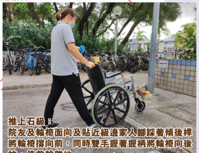
推上石級：院友及輪椅面向及貼近級邊家人腳踩著傾後桿將輪椅撐向前，同時雙手握著握柄將輪椅向後拉，使前輪離地