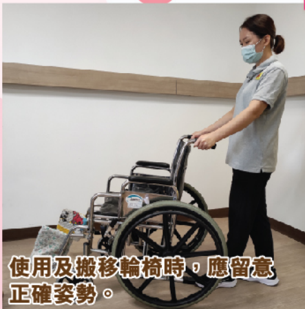
使用及搬移輪椅時，應留意正確姿勢。