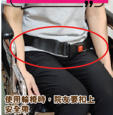
使用輪椅時，院友要扣上安全帶