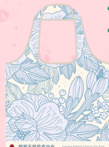
續會/入會禮物(數量有限)