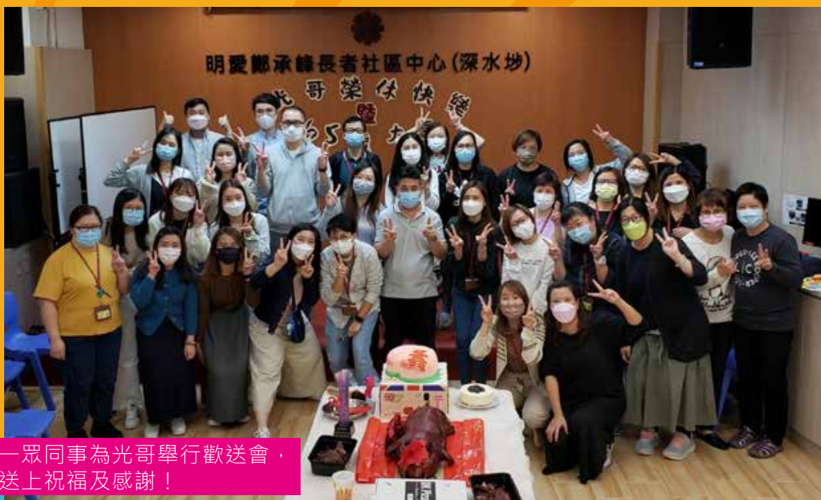
一眾同事為光哥舉行歡送會，送上祝福及感謝！