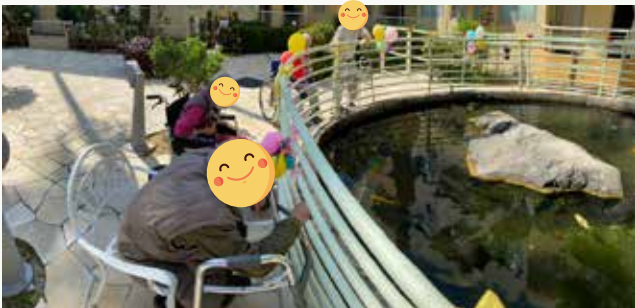
院友很開心觀賞魚龜玩樂

在2020年10月9日，本院舉辦龜池開幕典禮，龜池旁邊遍佈不同種類植物，為院友帶來五官刺激，既可進行訓練，亦可提供院友一個清新雅緻、寧靜閒適的地方。未來院舍會繼續善用龜池花園，與院友一同種植添姿彩，發揮園藝治療功能。