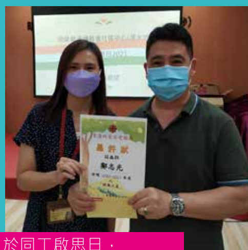
於同工啟思日，頒發健康之星獎予光哥