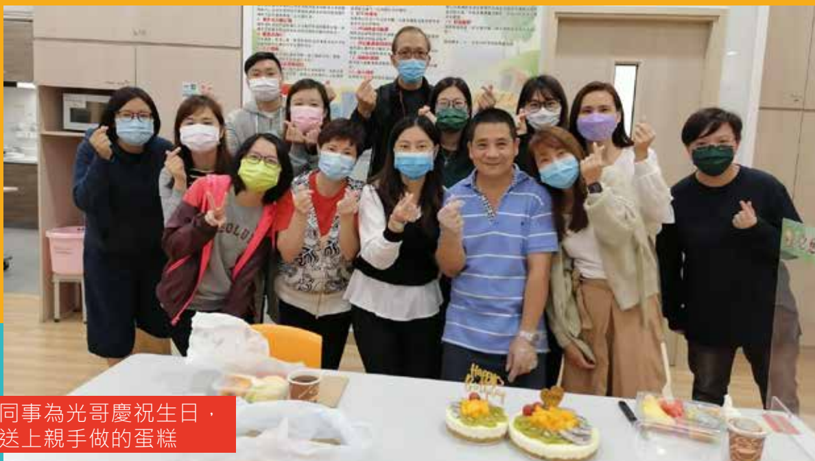
同事為光哥慶祝生日，送上親手做的蛋糕