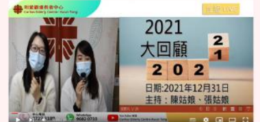
2021年12月31日 2021直播大回顧