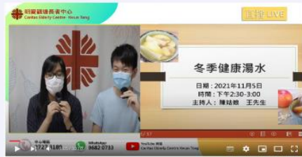
11月5日 冬季健康湯水