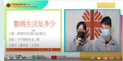
2021年11月12日 數碼生活知多少