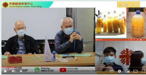
2021年11月30日 生活智慧王