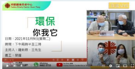
2021年11月9日 環保你我它