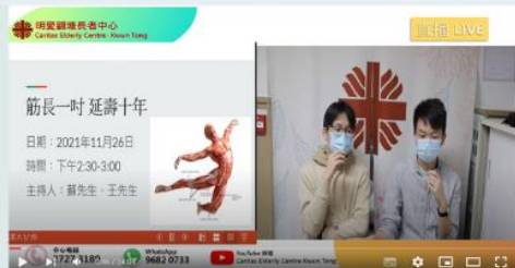
2021年11月26日 筋長一吋 延壽十年