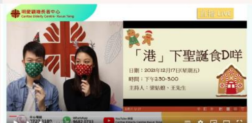
2021年12月17日 「港」吓聖誕食D咩