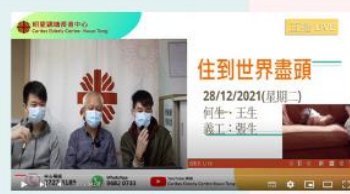
2021年12月28日 住到世界盡頭