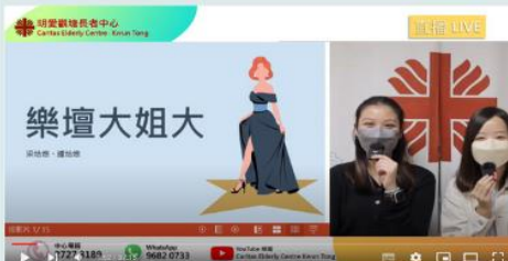
2021年11月19日 樂壇大姐大