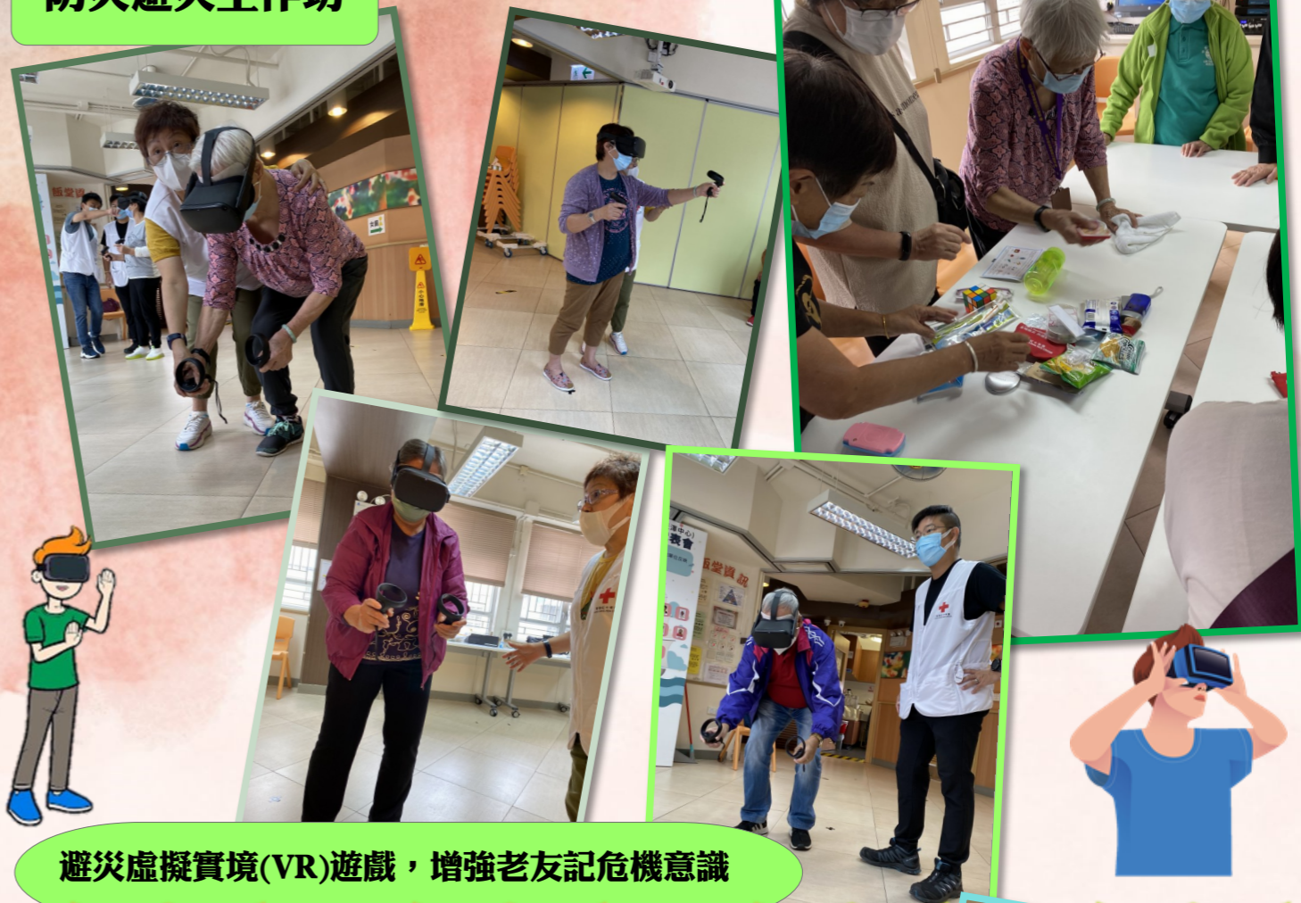
避災虛擬實境(VR)遊戲，增強老友記危機意識