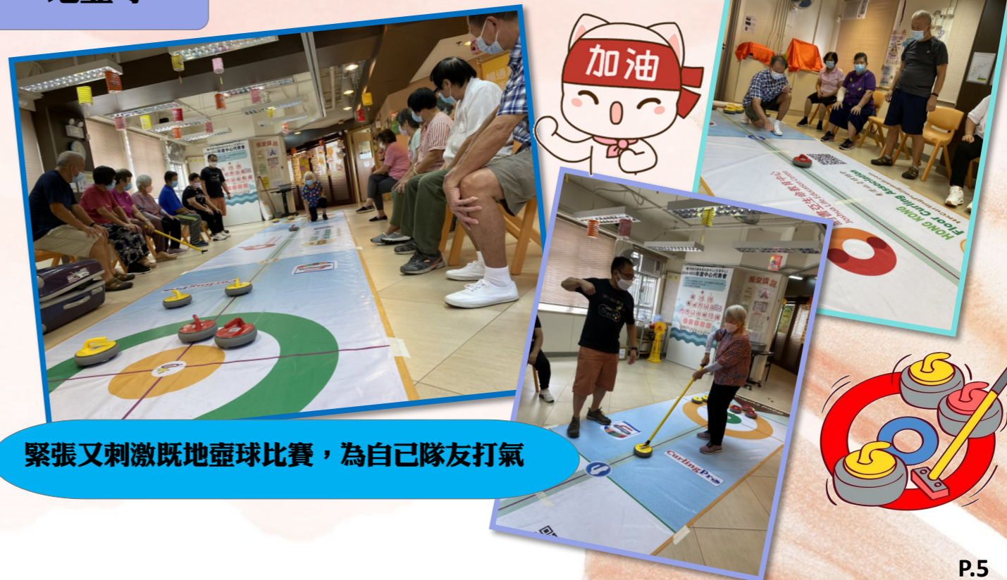
緊張又刺激既地壘球比賽，為自己隊友打氣