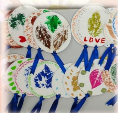
製作打氣卡送給社區人士