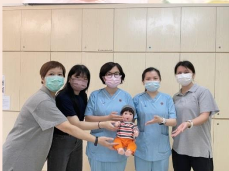
職業治療部同工與研發中的本地陪伴娃娃