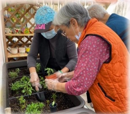
在平台花園種植辣椒

說起藝術，你會想起什麼？手工藝？還是畫畫呢？藝術其實是一個很大的範疇，當中包括園林藝術、烹飪藝術、視覺藝術等等。只有細心觀察便會發現生活中有不少藝術的足跡，例如：花園裡的盆栽、牆壁上的壁畫。人們從藝術中能夠感受到生命是豐富和有意義的，從中能驅使人在消極環境面前活出積極美好的生活。因此，院舍近年積極推行不同的藝術活動，尤其是園藝小組最受歡迎，院友在種植中體會萬物皆生有時死有時，因此需要學會活在當下，珍惜當下的事和人。