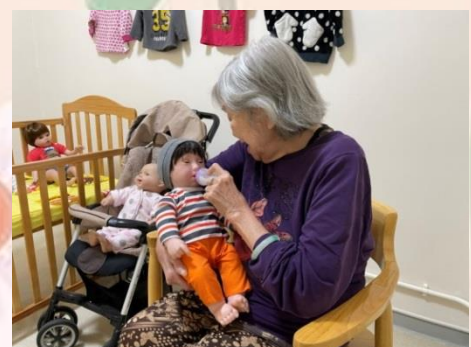
院友餵奶時，娃娃會發出聲音，以加強真實效果。