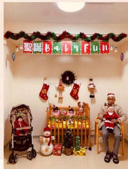
育嬰房於聖誕節時換上聖誕飾物，讓院友更能感受聖誕氣氛。