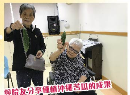
與院友分享種植沖繩苦瓜的成果