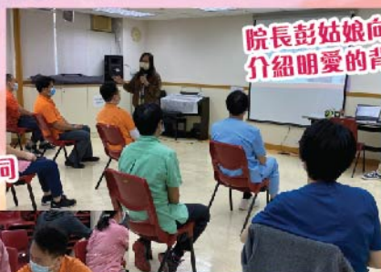
院長彭姑娘向新同工介紹明愛的背景