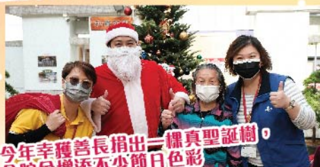
今年幸獲善長捐出一棵真聖誕樹 令院舍增添不少節日色彩