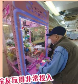
院友玩得非常投入

今年獲善長捐贈一部夾公仔機，五月至七月舉辦「抓找樂無窮」活動，將院友喜愛物品放入機內，巡迴在各樓層供院友自行夾出作禮物。