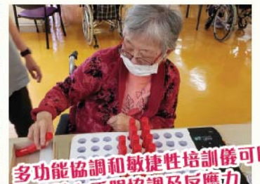
多功能協調和敏捷性培訓儀可以訓練院友手眼協調及反應力