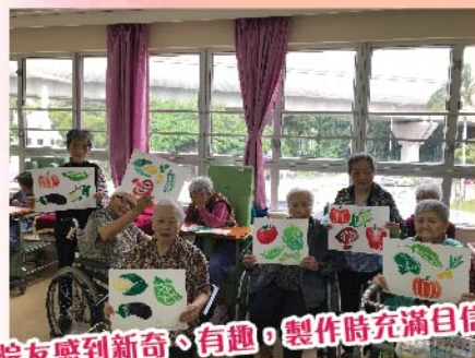
院友感到新奇、有趣，製作時充滿自信