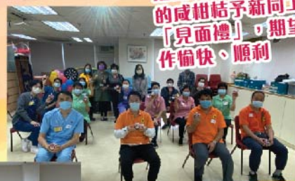
活動完結前送上院友製作的咸柑桔予新同工「見面禮」，期望同工作愉快、順利