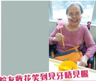
院友收花笑到見牙唔見眼