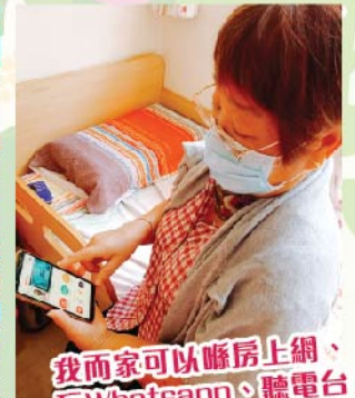
我而家可以喺房上網，玩Whatsapp、聽電台！