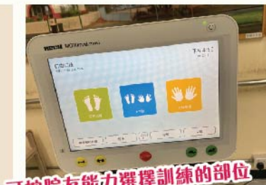
可按院友能力選擇訓練的部位