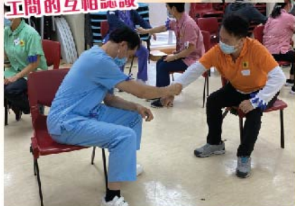
活動中有小遊戲，加深同工間的互相認識