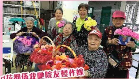
咁花都係我哋院友製作嘅