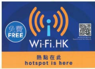
免費Wi-Fi服務由樂善基金撥款資助 (2020-2023年) Free Wi-Fi service subsidised by the Lotteries Fund (2020-2023)