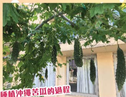
種植沖繩苦瓜的過程