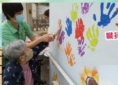
職員、院友合作完成壁畫