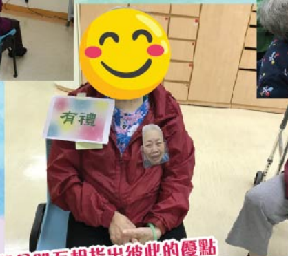
組員間互相指出彼此的優點