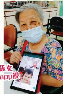
唔飯堂都可以同個孫女及曾孫女用whatsapp視像通話見面喇！

院友對Wi-Fi.HK意見正面，特別在疫情期間大大影響戶外活動，新增Wi-Fi可讓院友有更多娛樂，以下是院友對Wi-Fi.HK熱點的反應：