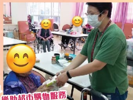
樂助超市購物服務