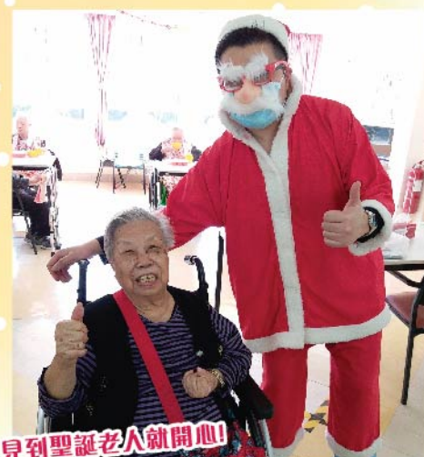
見到聖誕老人就開心!