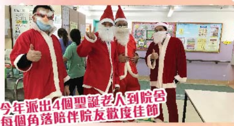
今年派出4個聖誕老人到院舍 每個角落陪伴院友歡度佳節

今年聖誕雖然未能與家人普天同慶，但本院亦準備了一系列的聖誕慶祝活動，希望院友在院舍內亦能感受到聖誕氣氛。