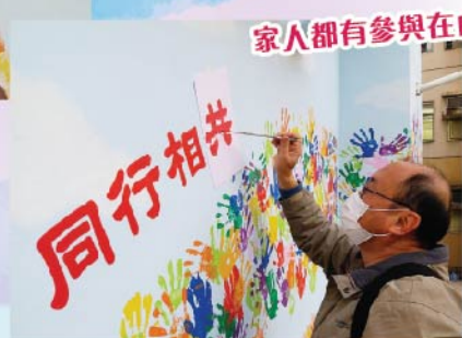
家人都有參與在內

明愛安老服務舉辦「師友承傳」培訓獎勵計劃，期望加強同工在服務中實踐機構的服務宗旨。計劃由前線社工帶領活動幹事策劃及推行活動，過程中能促進同工之間的知識交流，提升活動幹事對帶領活動的信心和技巧，以及鞏固彼此的社會工作價值及信念。