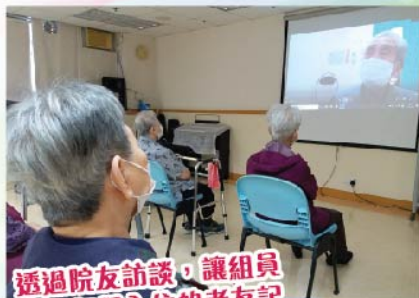
透過院友訪談，讓組員明白每個入住的老友記背個都有一個故事