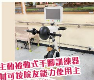
主動被動式手腳訓練器材可按院友能力使用主動或被動功能

透過「樂齡及康復創科應用基金」購入「主動/被動式手腳訓練器材」及「多功能協調和敏捷性培訓儀」以滿足院友對復康及認知訓練的需求。