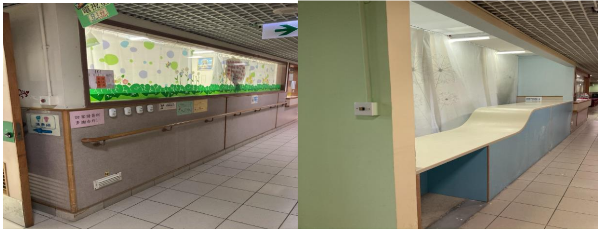
(前) 二樓電視室 (後)