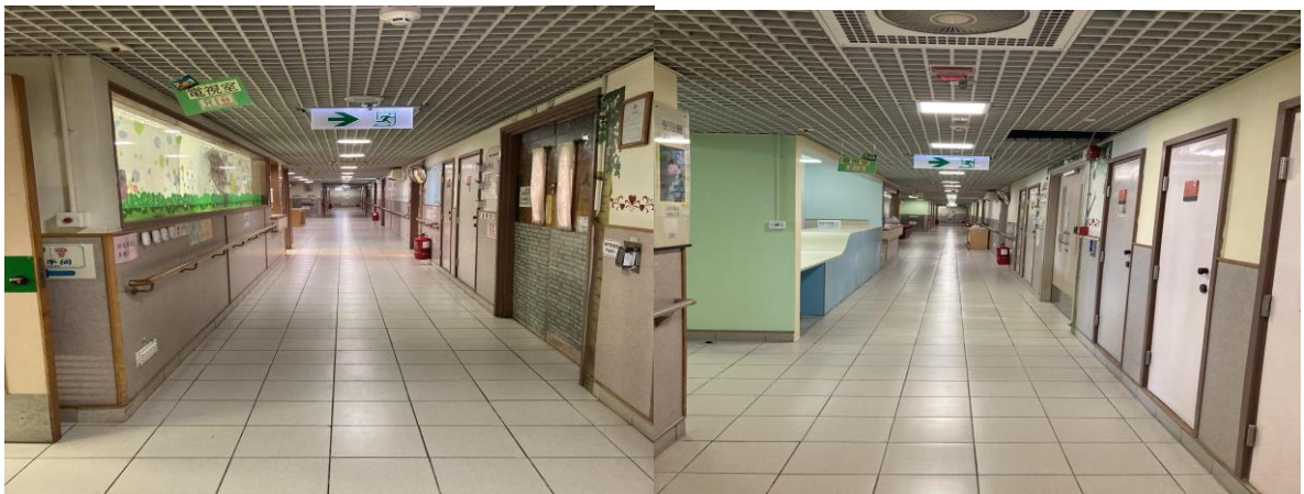
(前) 走廊 (後)