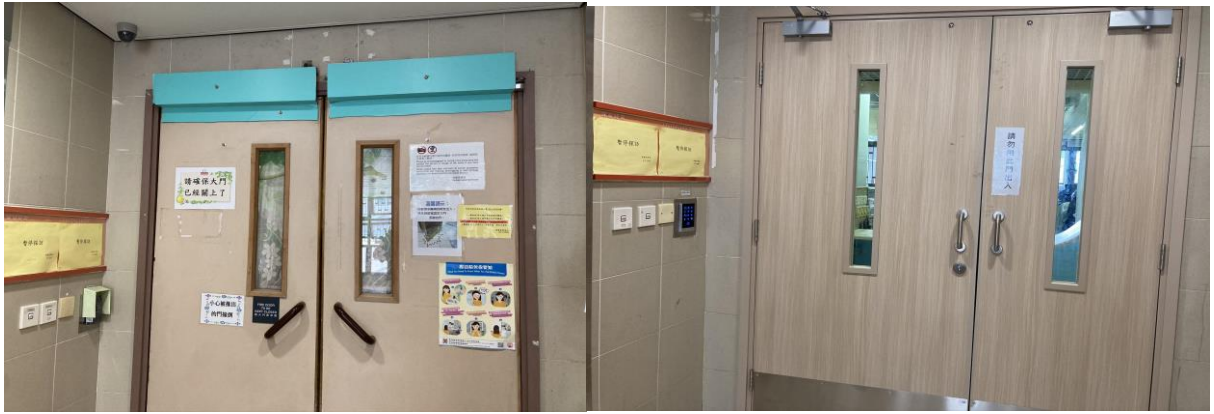
(前) 大門 (後)