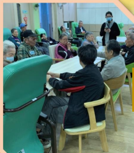
讀新聞+手指操/十巧操