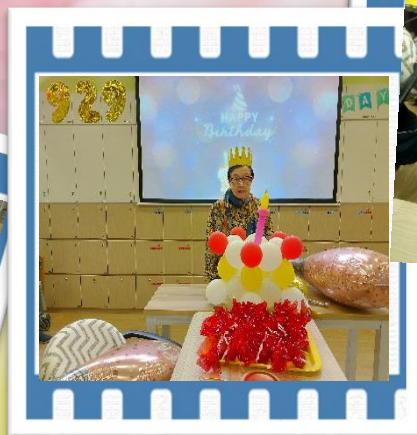
明愛茶樓暨生日會