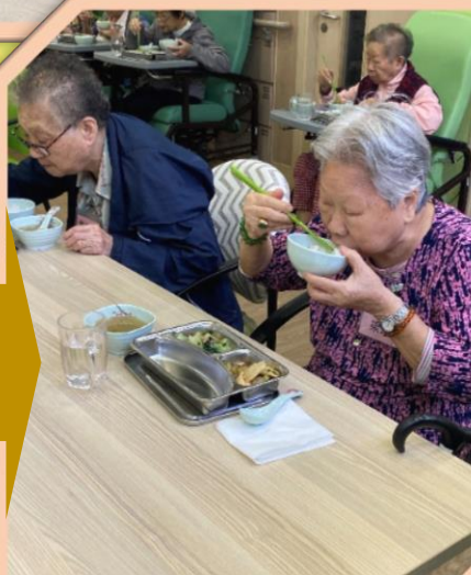
午餐 ：兩餸一湯 + 水果