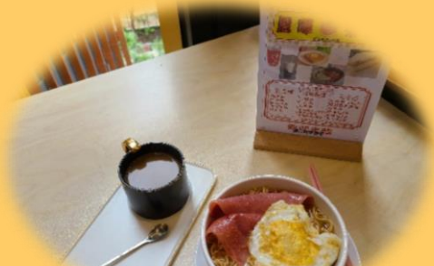
鎮店推介~上湯雲吞麵