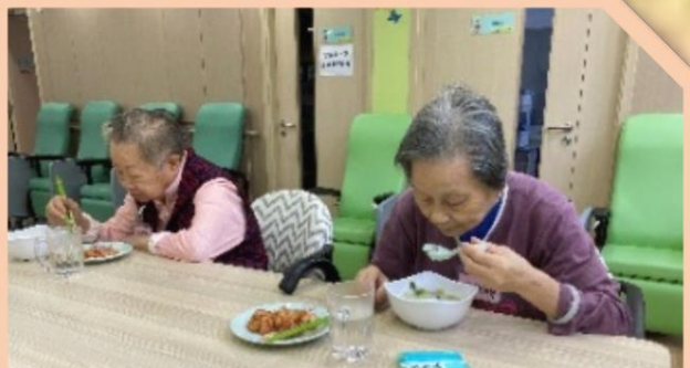
早餐 ：粥、粉/麵、中式飽點