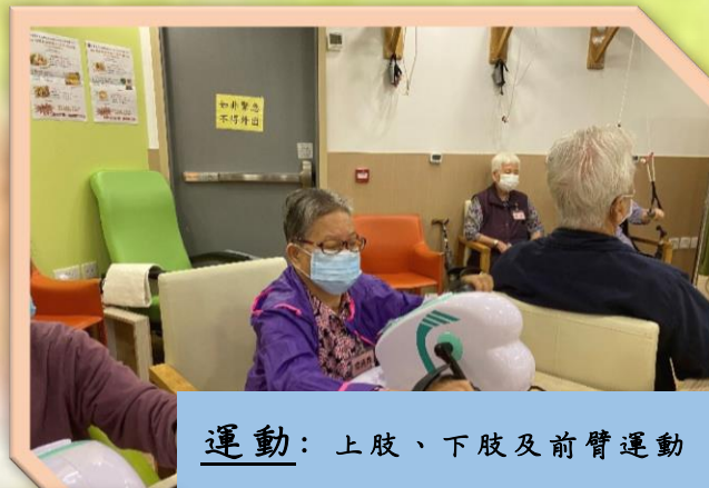
運動 ：上肢、下肢及前臂運動