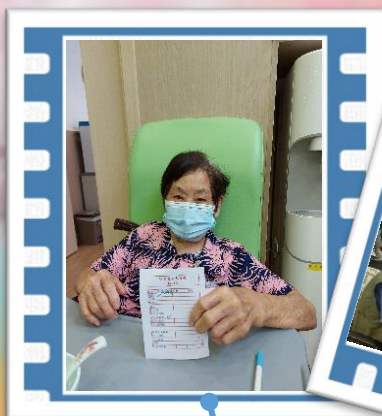
明愛茶樓暨生日會