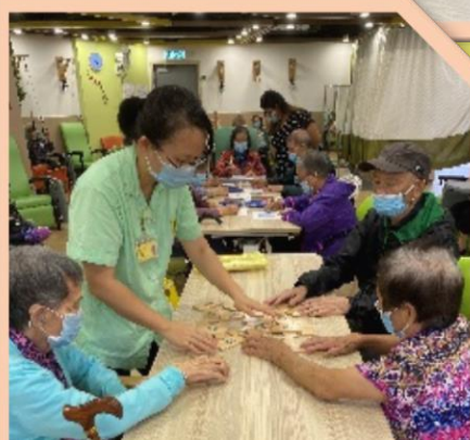
上午活動 ：多元化小組，讓老友記維持社交及延緩認知障礙症