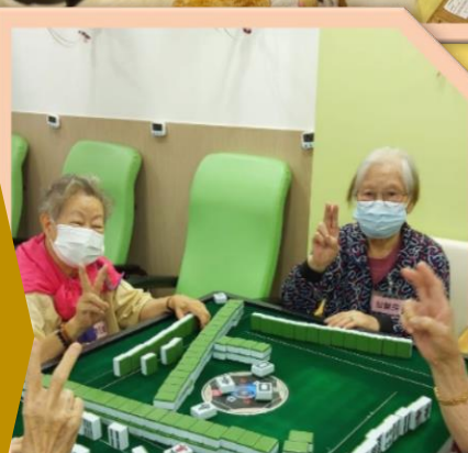
麻雀樂/休息 ：中心會安排認知障礙症會員打麻雀，以維持其認知功能。