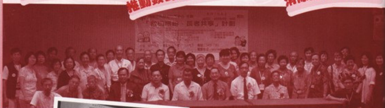
開展禮嘉賓及義工留影