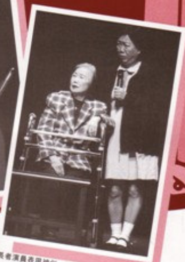
長者演員表現神似，博得全場掌聲。