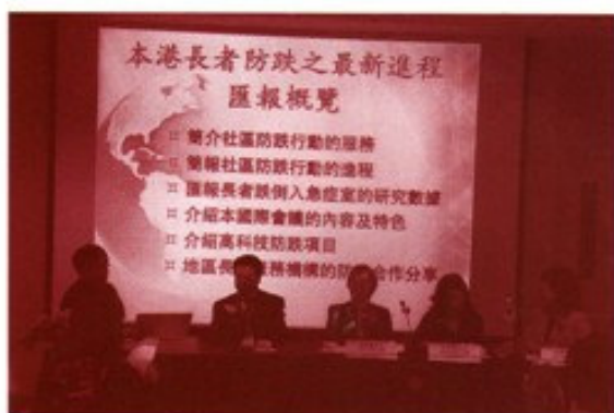
總主任出席九月十七日之預防長者跌倒及骨折國際會議及記者會

同時，為了吸取更先進的知識及加強交流，工作小組亦派員出席由香港中文大學矯形外科及創傷學系主辦的全亞洲首個國際性、跨界別合作的預防長者跌倒及骨折國際會議。這會議讓我們認識到海內外防跌專家的研究，及長者服務團體在社區內進行防跌措施、及防跌新科技的示範，有助我們深進防跌防骨折的行動。