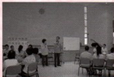
資深同工講解「機構使命你我知」，參加者聚精會神聆聽，聽罷一定「知」。

透過「如何在安老服務中體現明愛精神」專題分享中，深入淺出地道出「明愛服務，締造希望」的使命如何在長者中心、綜合家居照顧服務及院舍服務單位實踐情況，令參加者對「愛心爆棚」、「希望滿載」的口號，留下深深的印記。