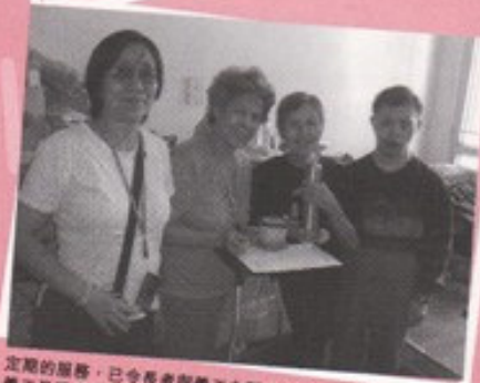
定期的服務，已令長者與義工之間建立起一份情誼，義工及受惠長者均笑逐顏開！