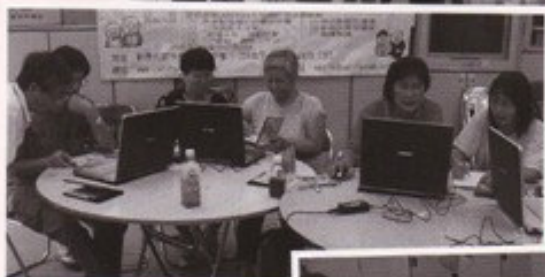
長者義工學習使用手提電腦

包括：宣傳開展禮、二手電腦回收、「數碼大使」培訓、IT長者資訊工作坊、參觀/講座交流、長幼聯網互傳情、數碼實踐及製作VCD及上網分享等。