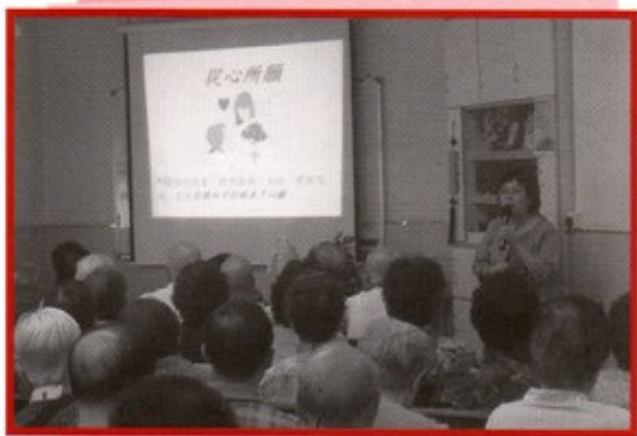
除殮葬實務事宜外，計劃亦包括「從心所願」項目，協助長者完成未了心願。

壽數非人定，然而人的生活態度是可以有所選擇的，儘管歷盡了多少個春秋寒暑，嘗透了人生幾許的喜與悲、苦與樂。在「死」這個正念或光境前，能釋懷放下，才能獲享安寧自在。「心靈關顧」，憑心對心，願意明白身邊長者，特別是那些弱勢的一群，協助其達成合理而可行的願望，了卻其未達的心願，這就是計劃中的「從心所願」項目，更是「寧安」服務的另一服務重點。此外，服務的特色是按申請人的意願，提供不同宗教儀式的殮葬服務，包括：天主教、基督教、佛教、道教甚或無宗教信仰，亦會為服務登記者（寧安之友）定期舉辦多元化的活動，包括支援教育性及聯誼活動，促進互助及擴闊生活圈子，讓以為自己只會注定孤家上路的長者，獲得心靈慰藉，鼓勵在互愛精神的生命圈內，積極邁向人生，畫出活的彩虹。