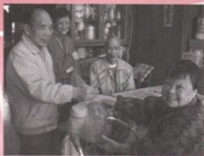
義工為剛出院的體弱長者提供「送餐」及關顧服務

以下篇幅，謹向大家概要介紹獲獎計劃-「服務耆老·你我做到」：計劃在二零零四年六月至十二月期間推行，旨在推動社區人士，參與義工服務。參與的義工包括數十位體健長者、婦女，及區內一班智障人士及他們的家長。計劃內容首先提供有系統的訓練，提昇義工的自信心及服務體弱長者的技巧，然後為社區中體弱的獨居長者，提供一連串的支援服務；包括「溫情靚湯慰耆老」、「每週靚湯速遞」及「醫社慰問一線牽」。