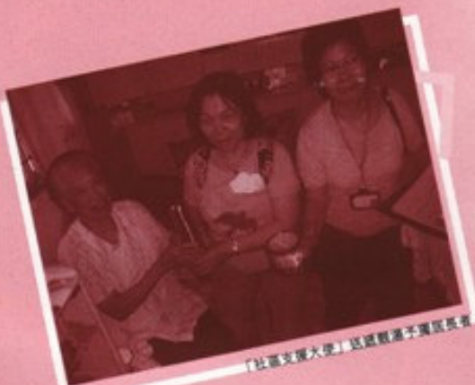
「社區支援大使」送湯贈予區內長者