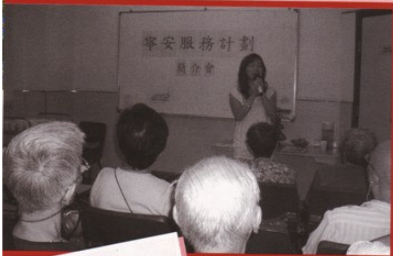
「寧安服務計劃」於06年 7月已經展開了！