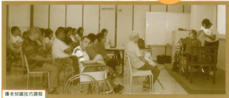
護老知識技巧課程

明愛護老者支援服務由本年四月開始轉型，將護老者支援中心原有之服務融匯於三十多個單位內，命名為「護老軒」。三十多個「護老軒」所提供之服務更加多元化，並且讓護老者能於更就近之地點接受服務。