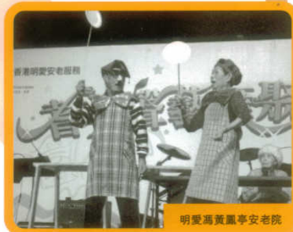
明愛馮黃鳳亭安老院