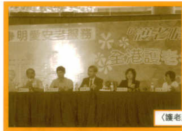
〈護老壓力知多少？〉論壇

透過面談、家訪、電話聯絡，聆聽護老者的心底話，協助護老家庭訂立全面護老計劃，減低護老者日常面對的壓力。