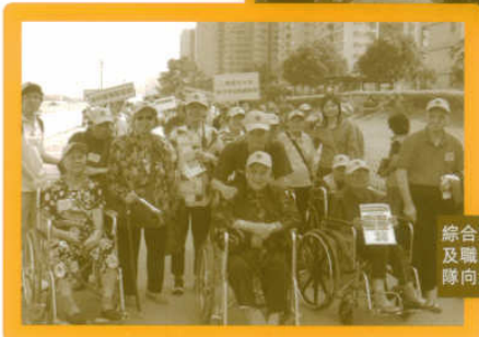
綜合家居照顧隊在義工及職員的鼓勵下，隨大隊向酒樓進發

一年一度的「積極耆英慈善步行」，可算是香港明愛安老服務的每年盛事。此項活動自1980年開始，一直至今都是由服務使用者，籌備活動，他們成立發動小組與工作員一同計劃，務求令各項程序能適應參加者的能力及意向，好讓參與者對活動留下良好印象，明年再次積極參與。