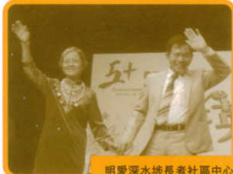
明愛深水埗長者社區中心

人地啲專業模特兒咁鎮定！」讀者可有同感？這句「原來我都得」背後意義深重！也是讓我們一班社會工作者感到欣慰的地方。