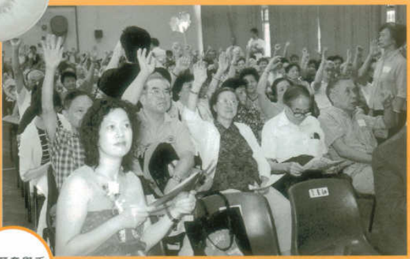
您願意舉手支持嗎？