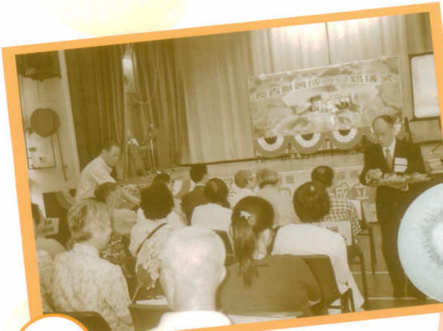
委員致送「奇異果」心意

明愛耆聲合唱團（一個由不同單位成員所組成的合唱團）為是次典禮，預備了十分恰當的賀禮，就是他們美妙的歌聲。合唱團今年亦再次在全港老人大大合唱中，勇奪三個獎項，是日真是一個好機會與大家分享這份喜悅。他們唱出家傳戶曉，大家耳熟能詳之「鼓舞」一曲，使整個典禮更添上朝氣及活力，合唱團之成功，正好為聯會樹立了「有目共睹」之榜樣。最後，希望藉此篇幅尋找對聯會工作及使命有心之人士，請大家不要客氣，隨時向工作小組成員多加愛心提點及善意指正。