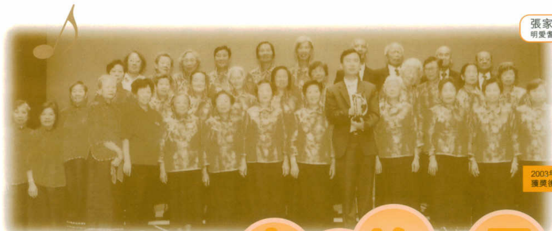
2003年「老人大大合唱比賽」 獲獎後與團員合照