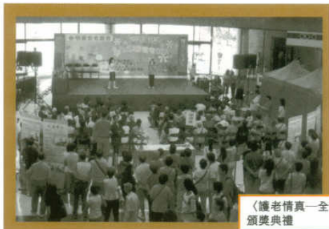
〈護老情真—全港護老者嘉許日〉 頒獎典禮

除了一年一度的護老者嘉許活動之外，“護老軒”亦會為各位護老者提供不同服務，現在為大家簡介“護老軒”之服務內容：