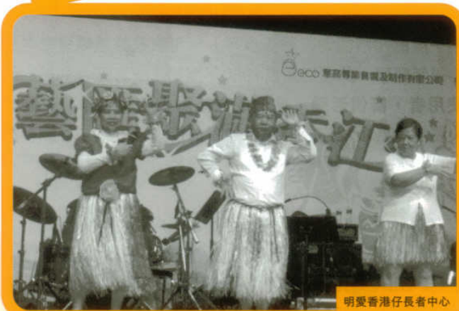
明愛香港仔長者中心