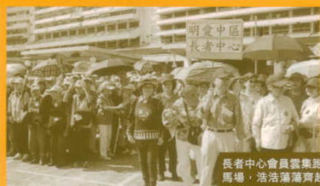
長者中心會員雲集跑馬地馬場，浩浩蕩蕩齊起步