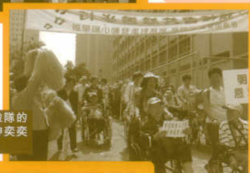
院友在啦啦隊的打氣下精神奕奕出發