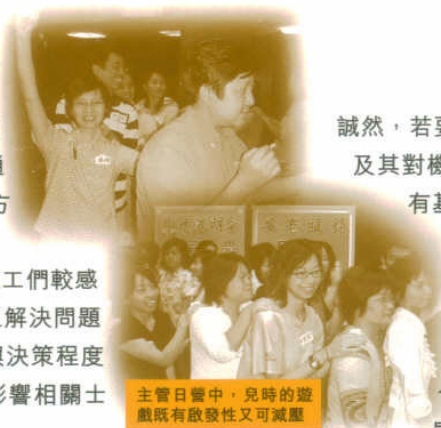
主管日督中，兒時的遊戲既有啟發性又可減壓

現時本服務正積極制定有關政策及指引，並有些單位在沙士期間後，自行開設一些輔導及同工短會，以疏導同事們的壓力。