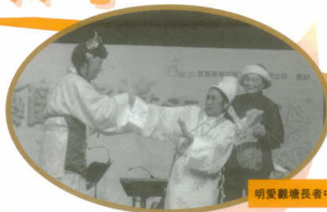
明愛觀塘長者中心

每一年，我們的服務也蠢蠢欲動計劃為長者提供發揮創意、表現藝術才能的平臺，讓長者在過程中經驗成功與滿足感。