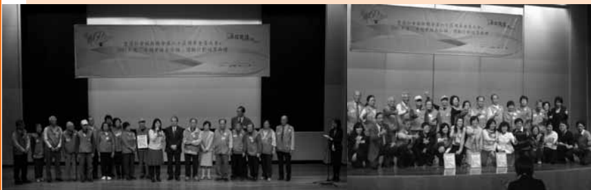
「卓越實踐在社福」獎勵計劃得獎人分享感受

本計劃在元朗及天水圍推行數碼共融活動。由2003年開始至2007年，總共1,956名長者，427名學生參與。計劃是培訓「長者數碼大使」成為社會資源，以電腦作為關愛媒體，透過「學習與服務」模式，鼓勵長者學習電腦後與朋輩分享，減少數碼恐懼。