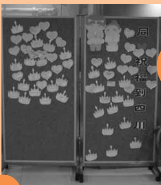
參加者為四川災民送上祝福字句