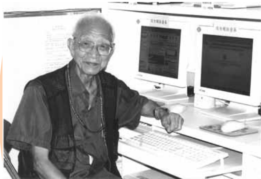
超伯開始學習電腦