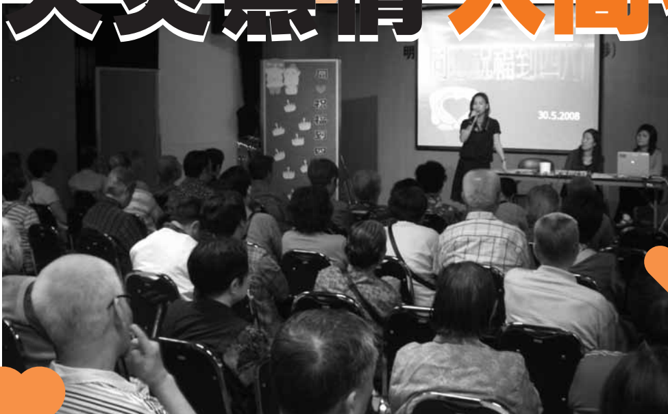
各參加長者均投入於祝福會中

四川地震，震動人心，明愛安老服務單位長者對事件的關注，和其他市民也一樣，於五月十二日四川天災發生後，也紛紛響應，為災民籌款，並已將款項悉數轉交明愛四川地震賑災基金，為災民出一分力。長者一向樂善好施，為善不甘後人，但在捐錢以外，中心也留意到部份長者的情緒因天災而波動，部份長者由於戰亂逃來香港，前半生亦奔波勞碌，老來亦在港孤家寡人，思前想後，感懷身世，對天災造成災民流離失所，家破人亡，感同身受。中心特於五月三十日舉行四川地震悼念會，有八十多位長者參加，當中程序包括匯報災情最新進展、回顧感人場面及帶出人生關愛重要、教導處理不安情緒、教授災難求生智慧等。長者們看到感人的場面，均“眼濕濕”，鐵漢也動容。有幾位長者因此天災而變得情緒困擾低落，工作人員即時留下他們，為他們提供即時輔導，讓他們明白情緒低落也是正常反應，可以多以正面態度思考，亦不須自以為「不正常」。