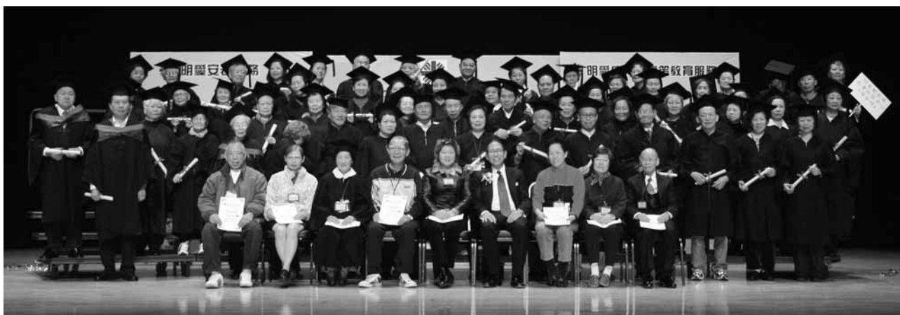
長青學員進行大合照