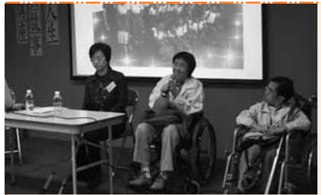
分享如何克服病魔折騰，積極生活。

因老化而產生的問題，似乎更難適應，嘉賓即場鼓勵長者要勇敢面對身體上的挑戰，我哋都得，你哋地一定要堅強些啊！”長者和嘉賓彼此鼓勵，互助扶持，場面感人，會後很多長者對此類分享均有正面評價，謂能夠對“厭世長者”作出鼓舞；其他單位如安老院舍也會安排他們和體弱長者分享，希望長者能振作起來，成為另一個“生命鬪士”。