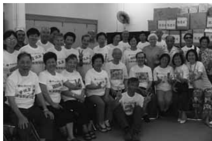
數碼大使合作無間，傳播愛心

IT工作坊的服務使我人生起了極大的變化，學了很多資訊科技的東西，如燒碟、PowerPoint、文書、倉頡、九方等。更認識到世界也在關注我們長者，使我更有信心把所學的東西和其他長者分享。