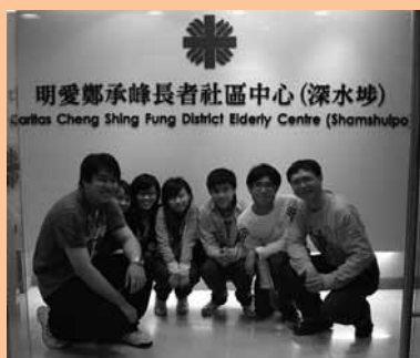
工作人員和導師合照留念

他們不少是獨老及二老家庭，但年輕的夫婦及兒童家庭亦不少，當中包括新來港家庭、低收入家庭、綜援家庭和單親家庭等。他們普遍是低學歷、少工作經驗和缺乏培訓機會，因此他們只能尋找工時長，工資低的工作，他們的子女一是缺乏家人照顧，一是缺乏經濟和學業支援，他們與同齡的兒童身體比較瘦弱，學業成績稍遜，缺乏成長機會（如電腦、歷奇訓練和海外體驗活動），造成跨代貧窮，拉闊貧富差距。