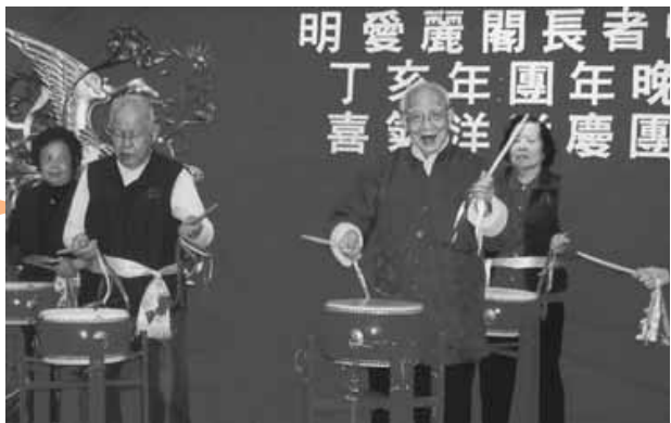
團年飯活動中表演活力鼓助慶