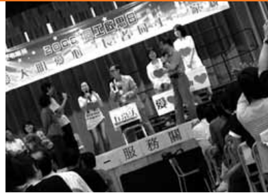
「一擲千心」，同工盡顯關懷與愛心。

於「一擲千心 - 服務關懷顯愛心」環節裡，大會安排了6位服務超過20年的同工分享他們在服務提供過程裡，如何浸透「愛心」、「關心」和「上進心」。主持們更化身為「千心小姐」及「陳堅庭」，讓參加者選擇