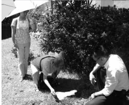
在工作員陪同下，太太親手把骨灰撒在紀念花園內。