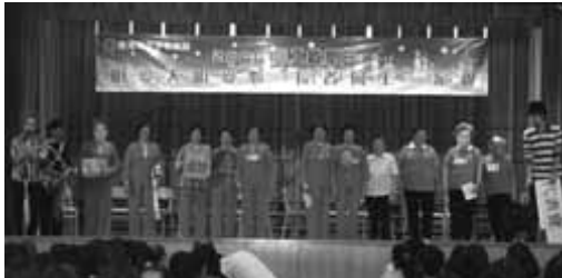
長者聯會一眾代表，以話劇形式表達如何能「老有所為」，十分有意思。

明愛安老服務於2008年5月10日及17日在深水埗寶血會嘉靈學校舉行一年一度的同工啟思日，出席同工達970多位。「明愛人明愛心·長者同工一家親」繼續成為本年度主題，這乃我們深信只有真心地明白長者需要，以「人」為本，才能以「愛」投入服務，盼望同工共同反思當中的意義。