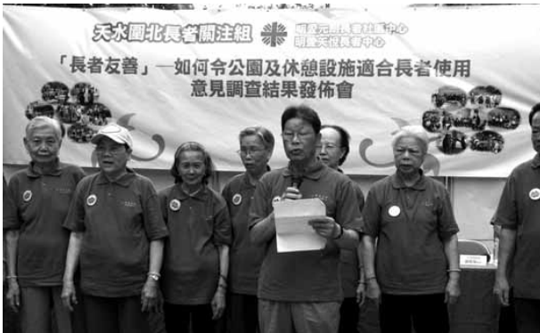
天水圍北長者關注公園及休憩設施