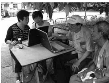
數碼大使在流浮山樹頭下教授鄉郊長者電腦

社聯亦將得獎計劃資料上載於「卓越實踐在社福」獎勵計劃網頁，如有興趣知道更多內容資料可於以下網址瀏覽：