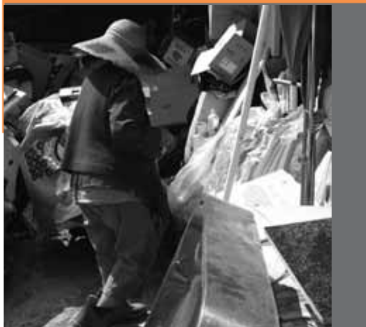
長者收集物品令家居環境非常惡劣

現時到中心參與服務之長者以女性居多，男性較少，就本中心之個案男女比例所見，男性佔一半，他們大部份沒有參加長者中心服務或從未到過長者中心，對中心服務認識不多。工作人員嘗試探討男女長者不願意參與長者中心服務之原因，男性長者表示對現時的活動不感興趣、與女性長者相處溝通有障礙、如接受服務是弱者表現、不習慣向別人表達感受等。而女性長者成為隱蔽長者之原因，主要因長期患病及家庭突發事故，在缺乏支援下令長者未能應付，變得退縮及性格改變，不願接受服務。