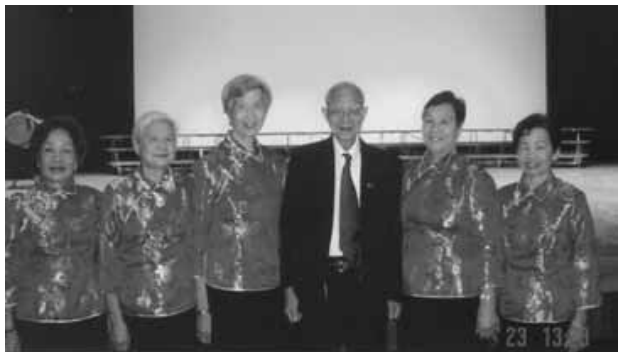
耆聲合唱團參加全港長者大合唱比賽