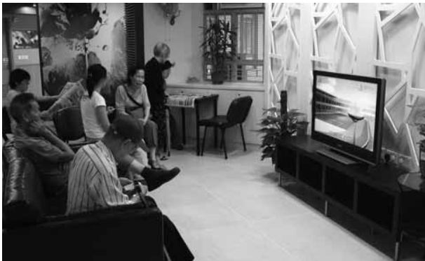
休閒閣—輕鬆樂悠悠