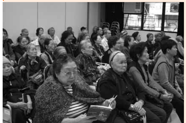
長者十分投入嘉賓分享