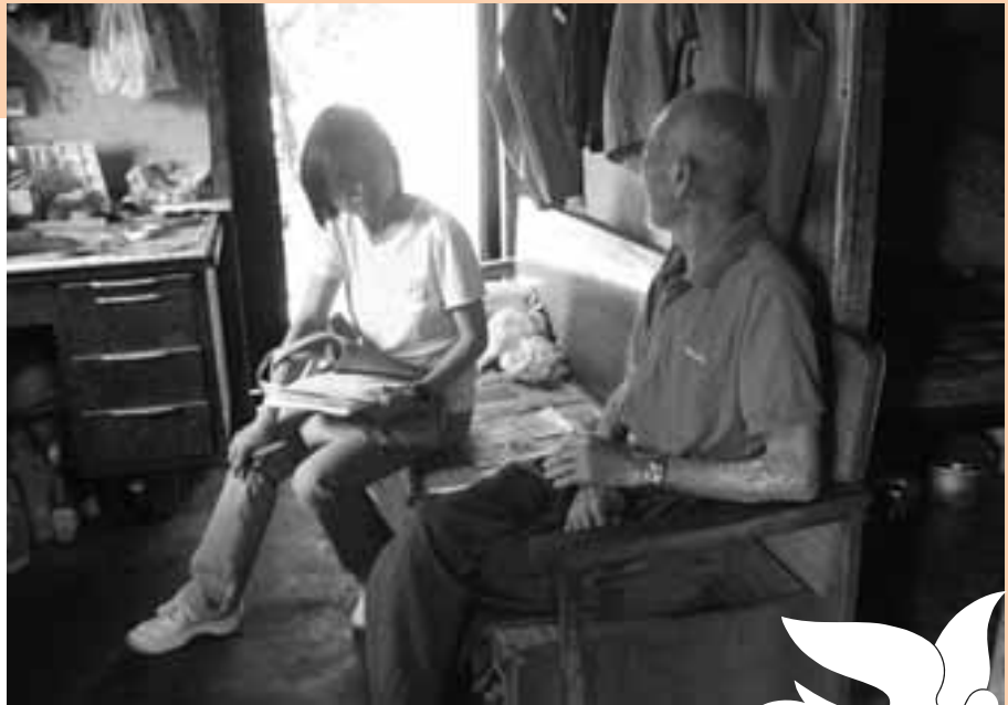
同工家訪隱蔽長者， 評估長者需要

本中心在二月至四月期間在元朗水邊圍邨進行宣傳，在義工協助下逐家逐戶拍門介紹中心服務，由於水邊圍邨的街坊大部份都認識中心，不少是中心會員，部份會員知道中心到訪顯得雀躍，感到中心十分關心他們，增加了對中心的歸屬感。同時拜訪區議員及參與屋邨管理諮詢委員會會議，詳細介紹服務及分享洗樓工作成效，最後邀請出席在邨內舉行的義工嘉許及服務推廣活動，初步建立了合作關係，社區人士對服務十分支持，活動能提升鄰里互助關愛精神。