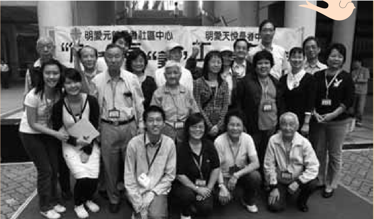
隱者小靈精義工嘉許及推廣活動