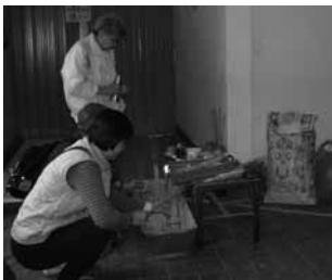
太太為丈夫送上最後的心意

丈夫離去時，她哭得死去活來，在急症室內她的身體在抖顫，哭訴著：「老公你為什麼不理我，留低我一個人，我點算……」她擁抱著丈夫的身體不停地叫喊，淚水濟滿了面前的亡人，這一刻她不想溜過，因為她心裡知道這是訣別，是她和丈夫相處最後的一刻，人生的痛苦著實莫過於此，從未經歷死別的煎熬，這份傷痛旁人是不會明白。