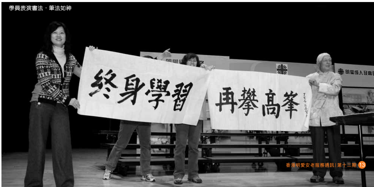
學員表演書法，筆法如神