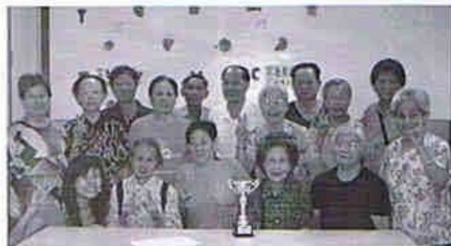
組員分享得獎成果