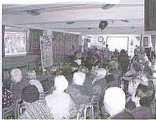
得獎者上台接受頒獎的一刻!

比賽吸引了學生的參與，亦引起了家長的關注。與學生一同製作小電影，間接促進了家庭成員的合作，促進了社會人士對長者的認識及了解，肯定長者的能力。