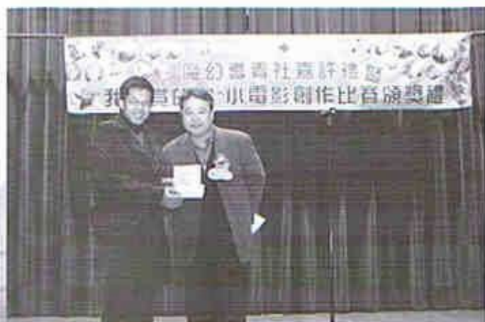
邀請長者一同投票選出得獎作品!

比賽吸引了學生的參與，亦引起了家長的關注。與學生一同製作小電影，間接促進了家庭成員的合作，促進了社會人士對長者的認識及了解，肯定長者的能力。