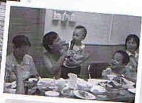
參加完「尋找歷史文化的足跡」，參與家庭真情分享，連小朋友亦大讚長者大使們好親切。