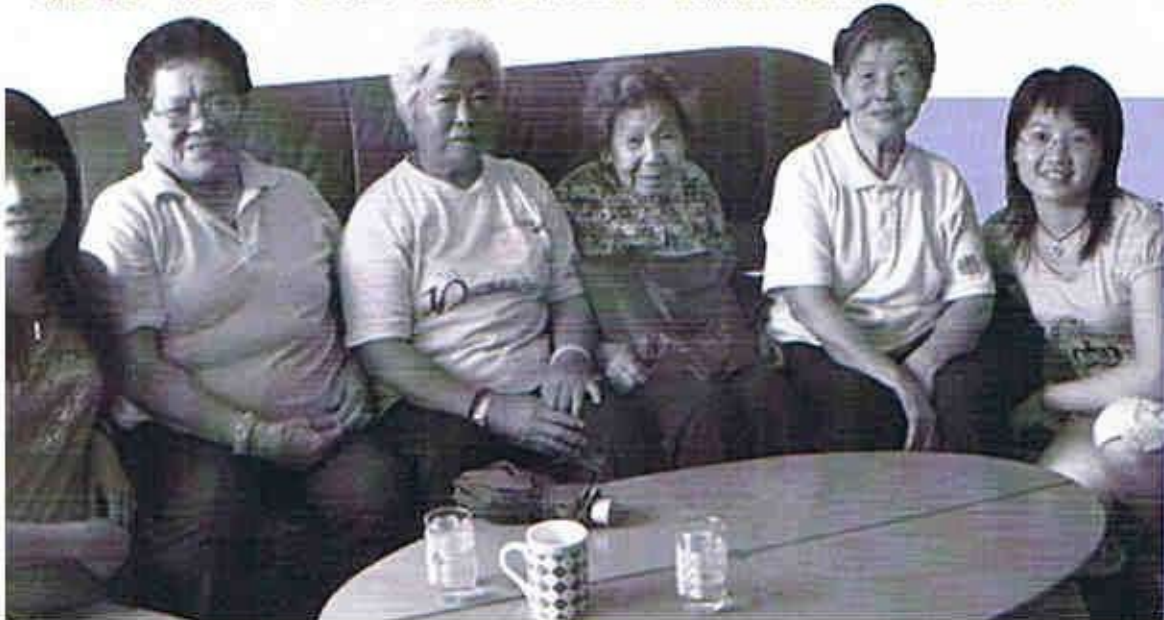
寓同學及義同學探訪長者家中

在西貢長者社區服務的實習期間，我看到了社工是如何將助人自助、平等、公平、正義的理念帶給長者的。而其中的“以人為本”的服務以及不斷檢討、創新的精神更給我留下了深刻的印象。