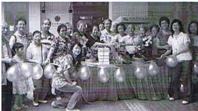
「喬遷之喜」當日切燒豬的情況

由於遷往新址對本中心會員一項很大的鼓勵，故此有會員自發籌款，購買燒豬慶祝「喬遷之喜」。當日氣氛相當熱鬧，還有一些舊職員前來祝賀，令各會員感受到這個大家庭的溫暖，而會員對中心的愛護及支持，實在令人欣賞。