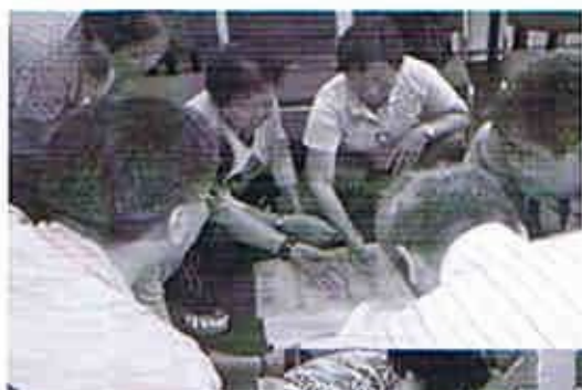
透過遊戲去協助護老大使認識明愛護老者支援服務