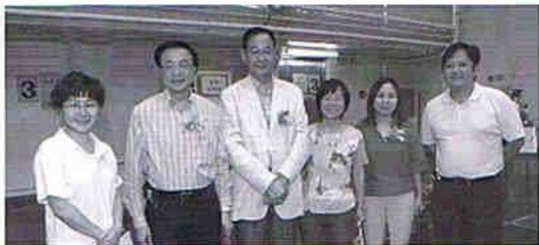
各合作機構代表合照(明愛安老服務、將軍澳醫院、西貢區議會、社會福利署)

有見區內護老者的健康及服務需要，不同的區議員及西貢分區委員會紛紛表示支持，他們均贊成促請政府於西貢區增設長者日間護理中心，並建議可運用區內一些空置設施，增設多些長者服務。