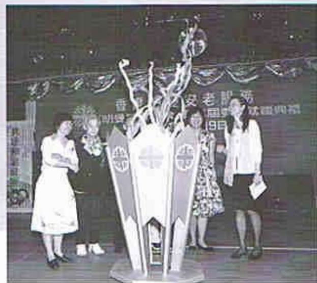
各嘉賓燃點火炬，祝願長聯發光發熱及蓬勃發展

從以上種種跡象看，明愛的會員已經體會到「長聯」對他們的重要性，我們有了這渠道，不但可以參與討論政策，甚至可以向議員及官員，表達長者的意見，為長者謀福祉。同時現今長者已經不是以前的「沉默一族」，而是站出來參與社區事務，發揮灰權力量的長者。藉著今年11月18日區議會選舉，明年立法會選舉，應該做好選民應有的認識，選出賢能，選舉前約見候選人，並舉辦論壇，選舉後的跟進及監察，看看他(她)們是否履行選舉前的承諾。至於政策方面，可以舉辦地區研討會，搜集長者的意見。