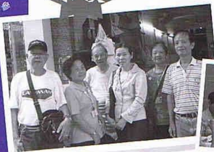
由長者文化大使親自設計行程，帶領新來港家庭參觀百年老舖，認識深水埗歷史。

由中心長者義工直接參與策劃及推行之「老有所為活動計劃」，繼05/06年度「耆妙人生放「義」彩」榮獲全港及地區最佳活動計劃後，06/07年度之「愛在『深』中百載情」系列，再次獲得地區最佳活動計劃獎項，再度印證長者參與之魅力及成就。