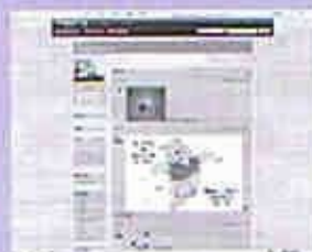
蘇淑真女士 (81歲) 網齡: 2個月, 學習電腦3年, 有十分豐富電腦經驗, 懂得數碼媒體製作。 Yahoo Blog 綽號: 福婆婆

因應社會現時的轉變，安老服務配合長者需要，將招募「數碼大使」，並舉行各類資訊科技分享會、工作坊，如：「BLOG BLOG網誌齊分享」、「BLOG BLOG心連心工作坊」及「聯網互傳情」等一系列活動。我們鼓勵長者參加透過「學習」，繼而「應用」，再而「服務」。目的是縮窄長者與外界的數碼鴻溝，達至數碼共融的社會。長者不想成為隱閉的一群，也需有一顆開放的心，多參與嘗試學習新事物。如想進一步知道有關學習資訊科技資料，歡迎與我們資訊科技隊聯絡，電話：24797383 電郵：hualice@caritassws.org.hk