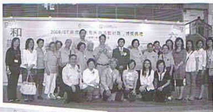
閉幕典禮上，義工籌委會代表與同嘉賓一齊參與典禮儀式，為深水埗這片福地注入無限愛心。