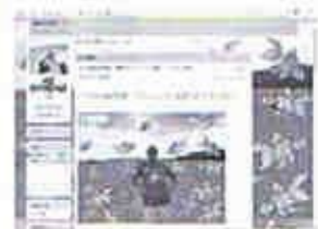
鄭天恩先生 (65歲) 網齡: 3個月, 學習電腦多年, 現時是長青學院電腦班義務導師, 有十分豐富電腦經驗 Yahoo Blog 綽號: 天恩

寫BLOG亦豐富了我的生活，我在BLOG內創作自己的小說，最近在寫「塘西俠俠」，已寫了很多篇。我可以當作家，是以前想也想不到的。而且還可以寫作自由，又有很多BLOG友讀者回應，有些是認識的，有些不認識。每天也有很多人上我的BLOG瀏覽（黃偉超先生的BLOG已累積有5萬多瀏覽人次），他們很多時也問候我。對於一些有問題的BLOG友，我會列他入黑名單，或不理睬他們的回應。我也與朋輩分享我的寫BLOG經驗鼓勵他們嘗試。