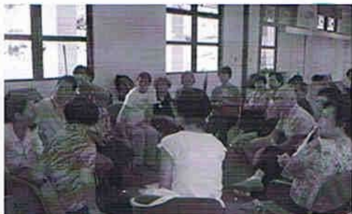
透過小組討論來集結參加者對護老大使角色與功能的意見。

在芸芸提議中，大家都有一個共識，就是護老者的生活節奏較為頻煩，在提供服務予他們時，應抱有耐心支持的態度，不要隨便放棄；其次，在三組討論匯報中，有兩組均建議定期為護老者舉辦「情緒舒發聚會」，讓他們將壓力互相傾吐，彼此作出支持，這才能真正地幫助他們減低心中的抑壓。