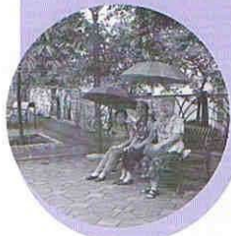
組員正在實地考察區內改善地方

天水圍北長者關注組以團體名義，於六月份參與由安老事務委員會、勞工及福利局、社會福利署、香港電台第五台合辦之「耆能盡現」社區建設計劃比賽。是次比賽參加者，須遞交改善社區環境或設施的建議書。小組提交了改善天澤邨與天恆邨之間休憩地方的建議，經大會評選團評審後，此建議榮獲比賽之優異獎。