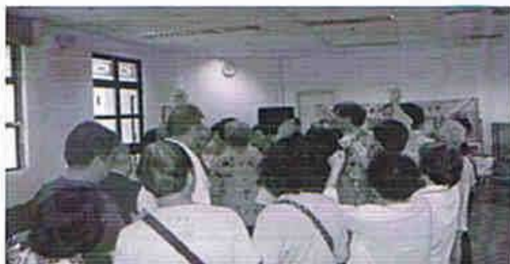
透過互動遊戲去促進護老大使們的認識

為了鞏固護老大使的角色與功能，及履行半年重聚一次的承諾，大會於2007年6月30日舉辦了「護老大使重聚日」。透過日常裡一連串的遊戲及小組討論，讓參加者掌握做護老大使的精神與技巧。至於在單位內協助關顧社區內的護老者，大使都能就過往的經驗，作出交流與討論，豐富了護老者支援的服務。