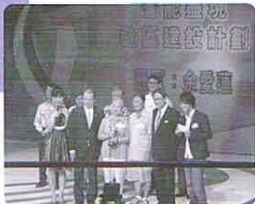
小組代表出席7月28日頒獎禮

小組兩名代表於七月廿八日，出席「積極樂頤年長者慶回歸晚會」內「耆能盡現」社區建設計劃比賽頒獎禮。建議書會提交區議會考慮改善方案，關注組期望區內改善之成效指日可待。是次榮獲優異獎，對關注組實為萬分鼓舞，關注組會繼續以自身出發，推動更多長者關心及參與社區事務，例如組員已整裝待發，全程投入推動長者參與本年之區議會選舉，希望更多長者會以建設美好社區為信念，貢獻每一分「銀色力量」。