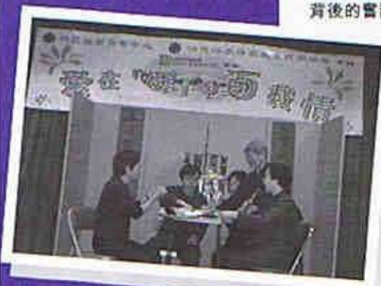
策劃過程中，義工們高質素配合編寫自製之深水埗發展話劇，將當年生活活現眼前。

有了共同的目標與理念，中心十六位長者義工特別組成了籌備小組，一同參與計劃之草擬工作，長者們之構思更順利獲得「老有所為活動計劃」撥款，令計劃很快便進入了開展階段，想不到推出之反應出奇理想，除馬上招募到五十多位不同年齡義工加入外，其中二十多位居住本區超過三十年之年長街坊更被邀加入焦點小組，透過重溫當年生活及經歷，共同勾劃出系列內話劇、短片、展板之大綱，成員當中的每段故事及經歷都成為了活動的主要元素，整個參與過程完全融合了長者本身的智慧及經歷，效果相當理想，亦非常配合本年度「老有所為」之主題。