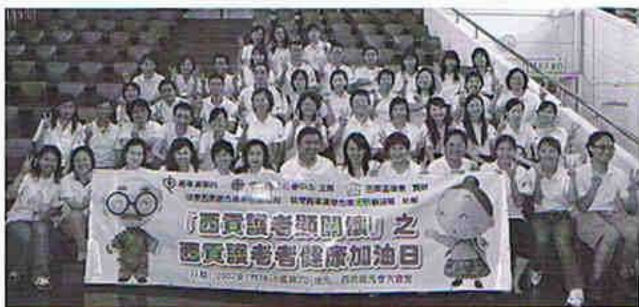
活動順利完成，明愛西貢長者中心的工作員及將軍澳醫院的義工一同舉起勝利手勢

明愛西貢長者中心與將軍澳醫院於本年五月至九月期間，合辦「西貢護老顯關懷」活動巡禮。透過不同形式的活動，如街展、健康評估及問卷調查、健康加油日及關注社區動力等，為區內護老者提供針對他們健康及社區需要的服務，讓護老者在貼身照顧長者的同時，感到社區亦認同他們的付出，並給予他們一股支持的力量。