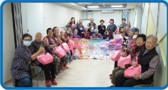
探訪東華三院王澤森長者地區中心