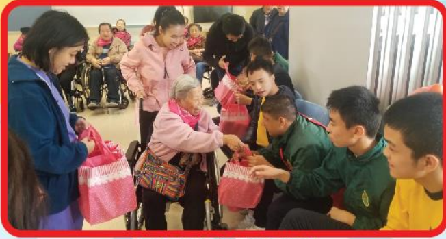
探訪明愛樂進學校

於不同時節舉辦探訪交流活動，並帶備自製食品，送暖到區內有需要人士如獨居長者、雙老家庭、私營院舍、長者中心等，發揮關愛鄰里精神。