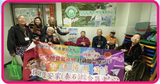
探訪佳安家綜合護老中心