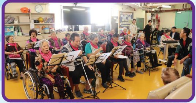
探訪明愛賽馬會長者日間綜合服務中心