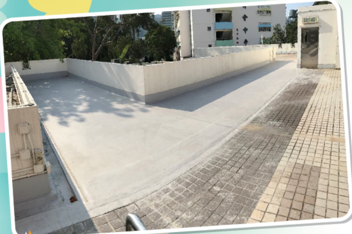
驗窗工程及2/F平台防漏工程 已完成，平台已重新開放使用。