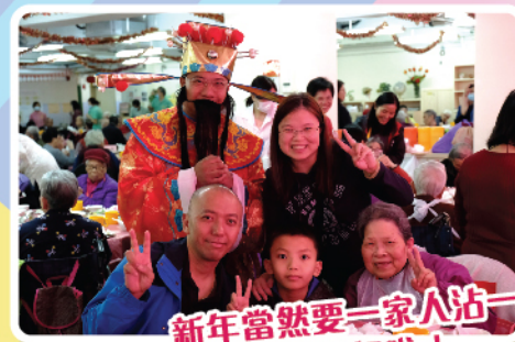
新年當然要一家人沾一下財神的財氣啦！