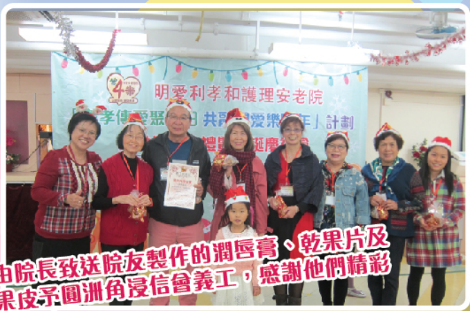
由院長致送院友製作的潤唇膏、乾果片及果皮茶圓洲角浸信會義工，感謝他們精彩的表演

「耆孝傳愛聚沙田 共融關愛樂頌年」為社會福利署撥款的「老有所為」計劃，期望增加院舍長者與社區的連繫之餘，亦能讓長者發揮潛能，貢獻社會。藉著普天同慶的日子，與一眾院友及家人回顧過去一年的付出和努力。