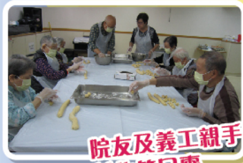
院友及義工親手製作笑口棗