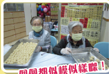
個個都似模似樣㗎！