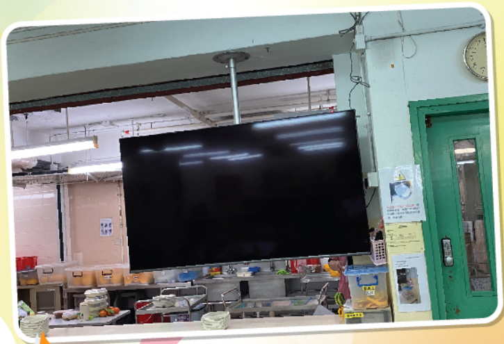
1/F飯堂更換65吋大電視