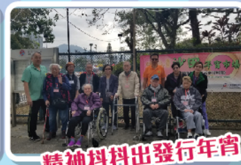
精神抖抖出發行年宵