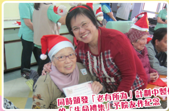
同時頒發「老有所為」計劃中製作的「生命禮集」予院友作紀念