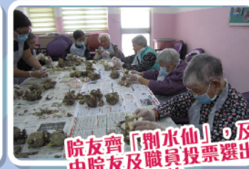
院友齊「割水仙」，及後由院友及職員投票選出最愛的水仙花