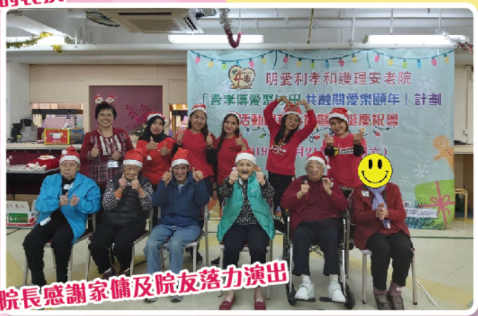
院長感謝家傭及院友落力演出