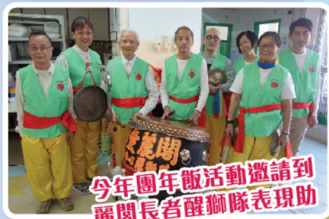
今年團年飯活動邀請到麗閣長者醒獅隊表現助慶，熱鬧非凡