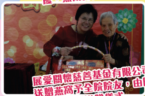
展愛關懷慈善基金有限公司送贈燕窩予全院院友，由院長代表進行送贈儀式