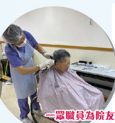
一眾職員為院友理髮