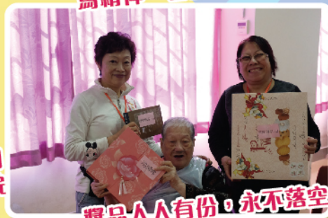
獎品人人有份，永不落空