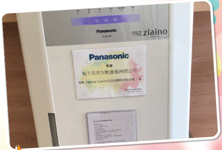
玻璃門位置增添了Panasonic空 間清淨機，亦將添置光觸媒機