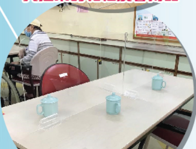
於院友飯桌加裝膠板，加強感染控制