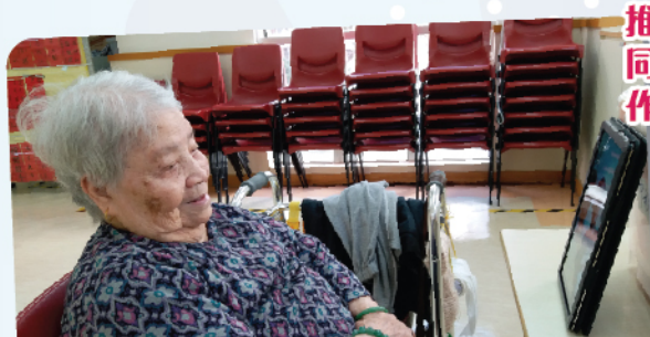
開放視像通話予家人預約