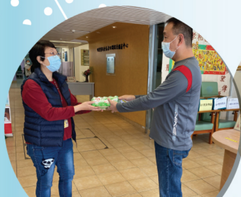
安排職員於玻璃門位置接收家人送來的乾糧及日用品

由於新冠肺炎疫情影响嚴重，為保障院友安全，本院現已暫停所有探訪及集體活動，直至另行通知。但理解家人惦掛院友，而且院友亦有不同需要，故推出以下服務：