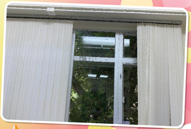
職業治療室天花滲水工程已修葺