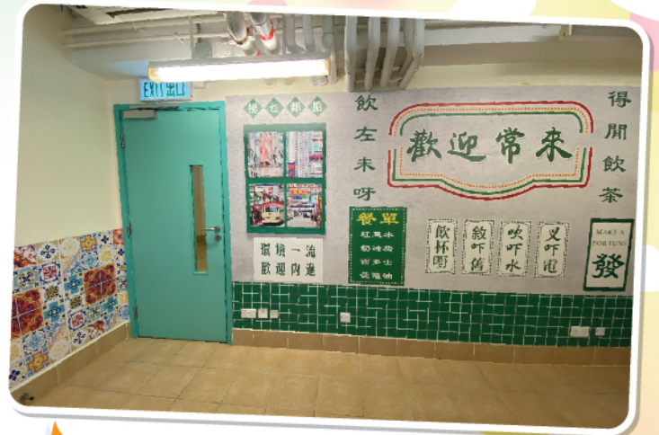
G/F互助社貼牆紙，改裝活動室