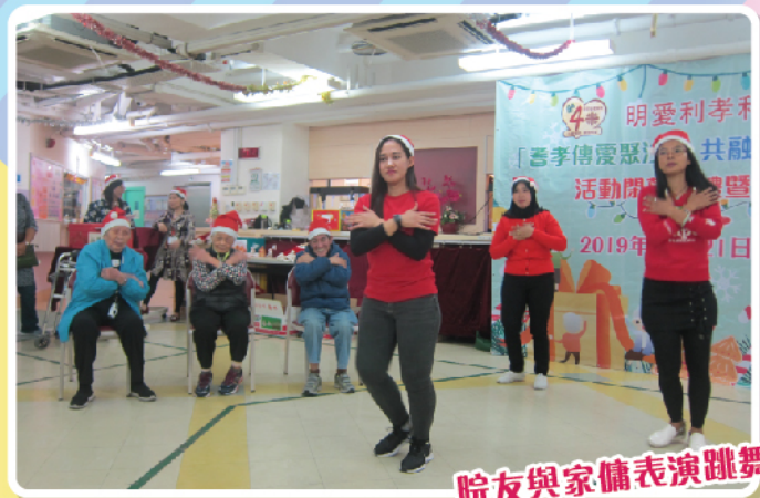
院友與家傭表演跳舞