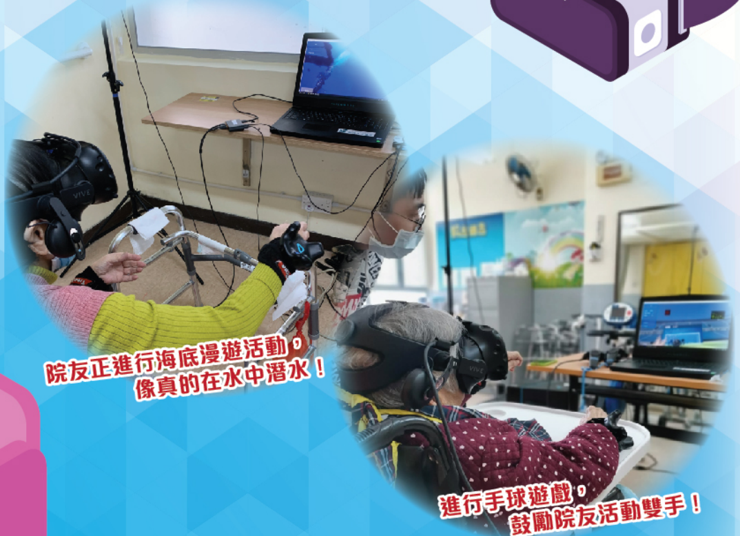
院友正進行海底漫遊活動， 像真的在水中潛水！