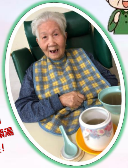
慈善下午茶，院友對廚師的燉川芎白芷魚頭湯讚不絕口呢!