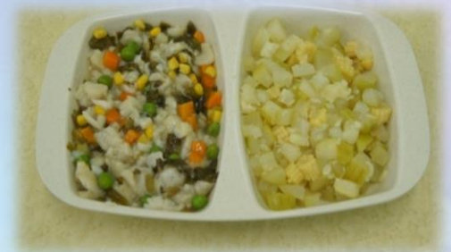
碎餐減少某些餐種的差距