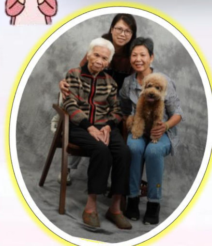
慈善攝影日：家人帶來院友愛犬一起拍照，場面溫馨感人