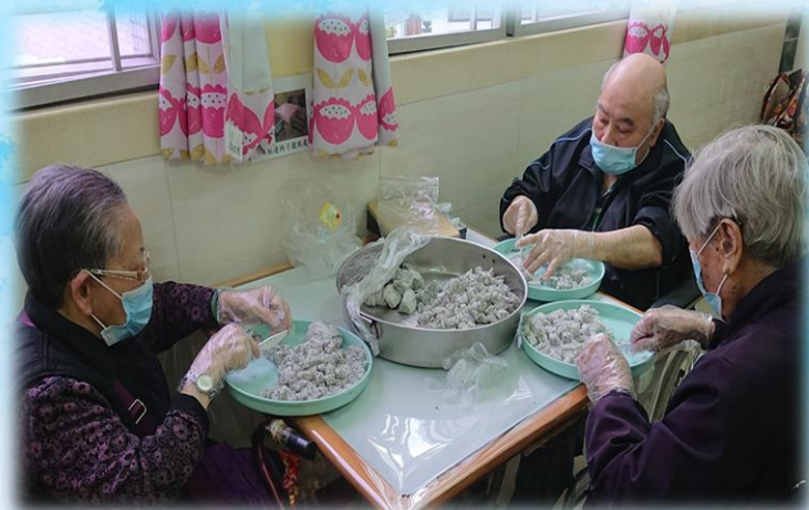
院友協助預備火龍果供晚餐用

「耆義餐廚助手」是院舍新組成之義工小組，邀請多位院友成為義工，為全院院友預備餐前水果或協助廚師預備食材等工作。