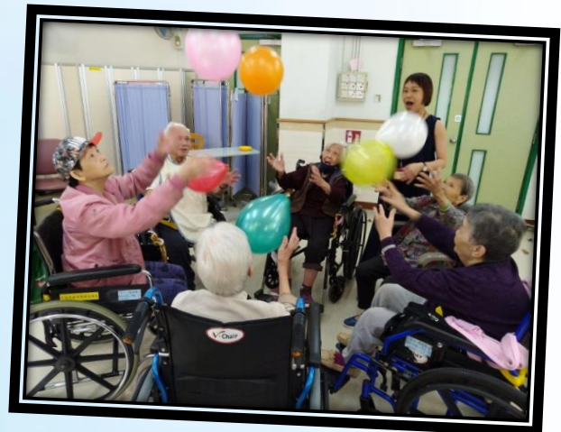
耆幻藝行小組與院友進行遊戲，院友們都面帶歡笑