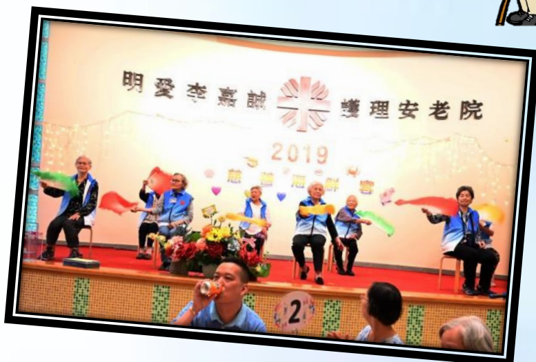
快樂椅子舞小組成員於慈善海鮮午餐表演一曲〈路邊的野花不要採〉扇子舞