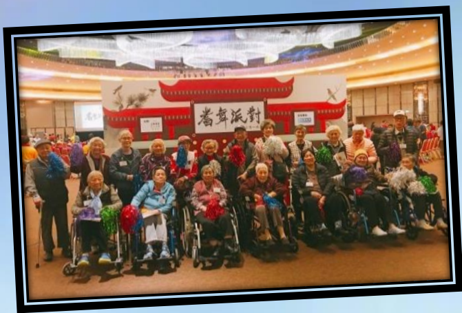
院友前往國際展覽中心，參加由尊賢會舉辦的「耆舞派對 2019」。讓院友與場內逾千位參加者一同享樂及交流椅子舞