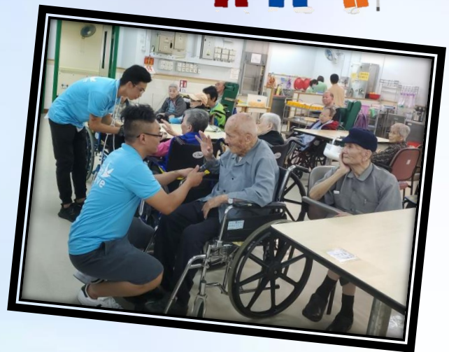
魔法義工團隊探訪為院友帶來魔術表演