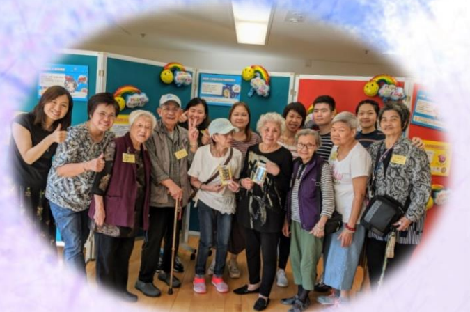
一班老友記和院舍職員到場觀賞首演