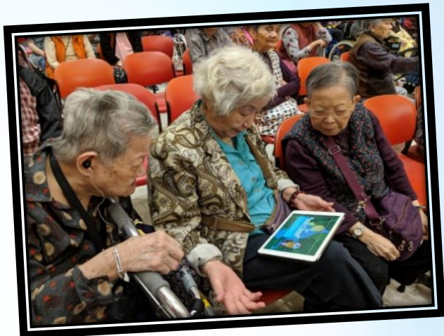
小學生義工到院舍探訪，讓院友們體驗平板電腦及 VR 眼鏡，院友們感到十分新奇