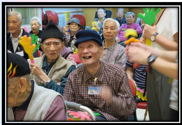
每三個月舉行的生日會，替生日月份院友慶祝生辰，送上祝福及帶來歡樂