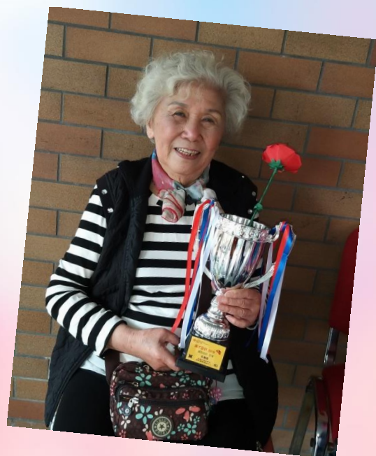
活動當日手工組的院友親自製作 的花束祝賀曼羅獲獎