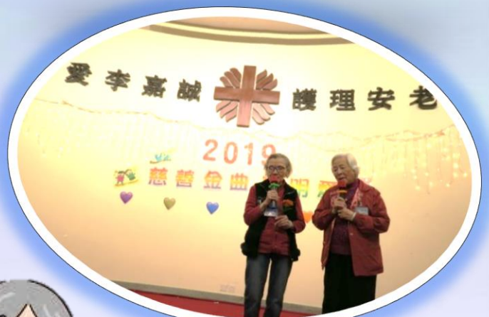
院友大力支持慈善金曲耀明愛，更合唱名曲「相識也是緣份」!