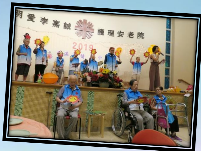
耆樂歡聚小組在中秋節活動演出應節的民間故事 — 「嫦娥奔月」