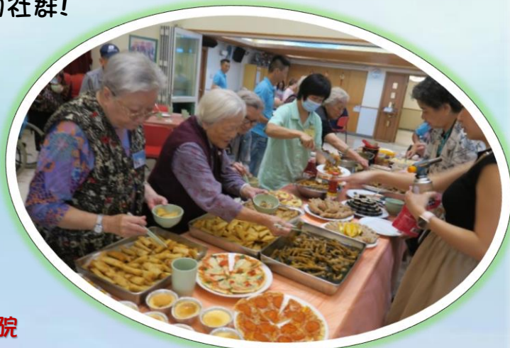
慈善放題：參加院友對著美食胃口大開，開懷暢飲!