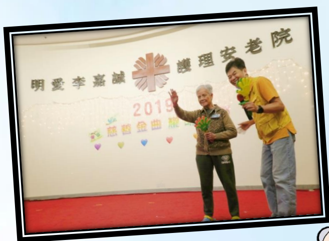
王婆婆在慈善金曲耀明愛活動中，與職員為大家獻唱「友誼之光」