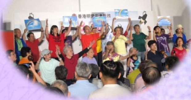
與團友一同努力為首演傾力演出