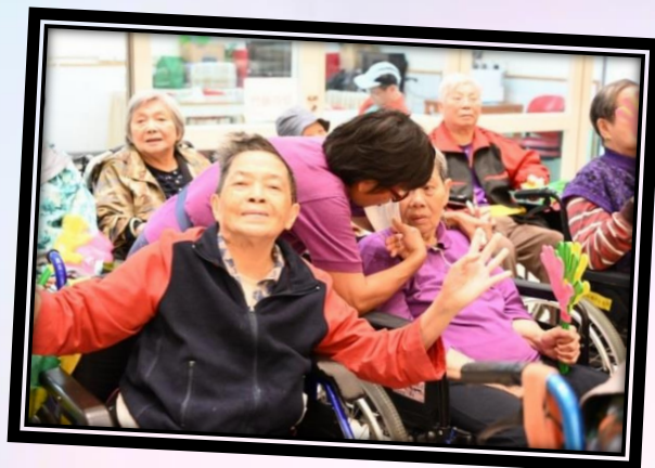
宋婆婆最喜歡的名曲會知音活動，邀請不同義工團體為院友表演金曲，院友樂在其中